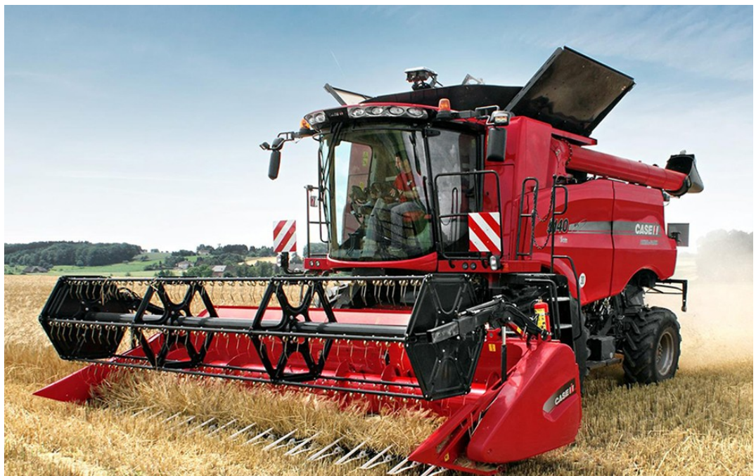
Рисунок 1.6 – Зернозбиральні комбайни Case IH Axial-Flow

Для виконання цієї операції використовують: зернозбиральні комбайни Дон-1500; Славутич; John Deere серії W та T; New Holland CX; Claas Lexion; Case IH Axial-Flow.