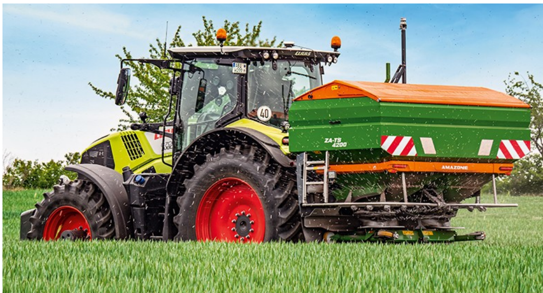
Рисунок 1.3 – Агрегат для внесення твердих мінеральних добрив Amazone ZA-TS

Для внесення твердих мінеральних добрив використовують: МВУ-5; МВУ-8; РУМ-5; Amazone ZA-M; Amazone ZA-TS; Rauch MDS; Kuhn Axis.