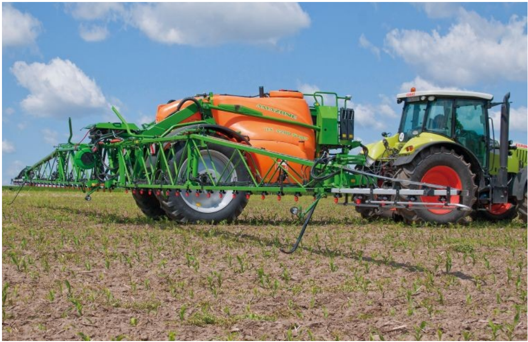
Рисунок 1.5 – Причіпні обприскувачі AMAZONE UX Super

Для виконання цієї операції використовують: зернозбиральні комбайни Дон-1500; Славутич; John Deere серії W та T; New Holland CX; Claas Lexion; Case IH Axial-Flow.