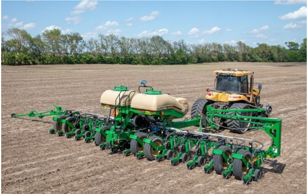
Рисунок 1.5 – Зернова сівалка Great Plains PL5700

Використання сучасних пневматичних сівалок дозволяє суттєво підвищити якість посівних робіт та продуктивність агрегатів.