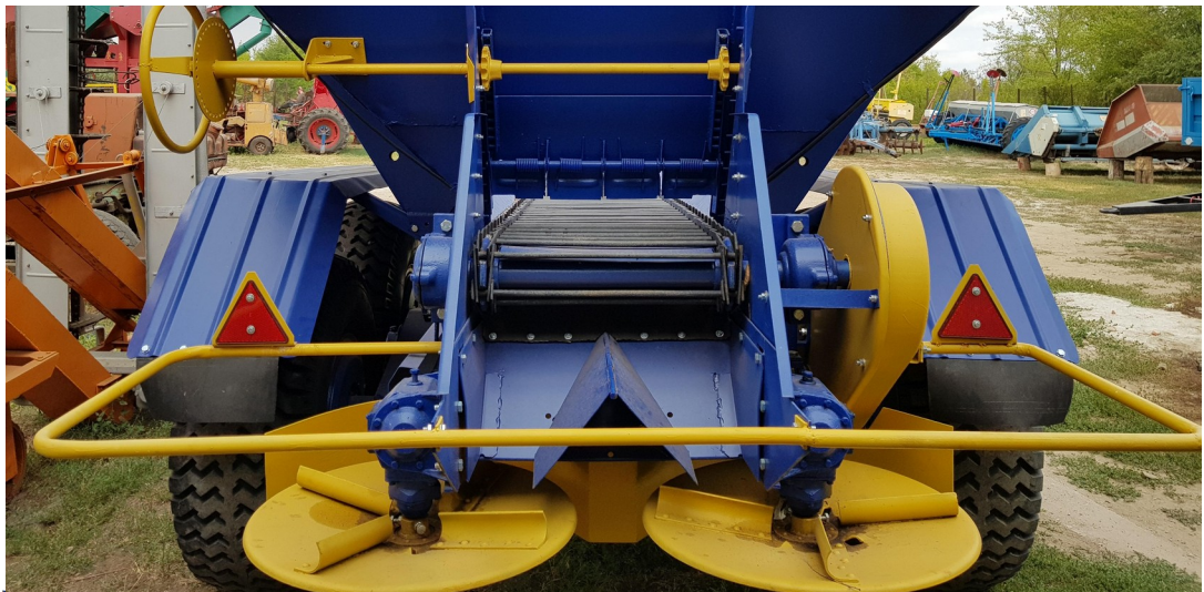
Рисунок 3.2 – Виконавчі механізми розкидача мінеральних добрив МВУ -8 базової конструкції

Норма внесення може змінюватися в широкому діапазоні, що дає можливість використовувати машину для різних видів добрив та технологій вирощування культур.