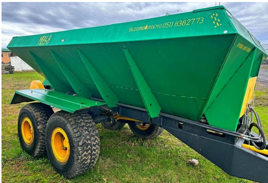
Рисунок 3.1 – Розкидач мінеральних добрив МВУ-8

Розкидач є напівпричіпною машиною і агрегується з тракторами тягового класу 1,4–2,0, обладнаними валом відбору потужності та гідросистемою.