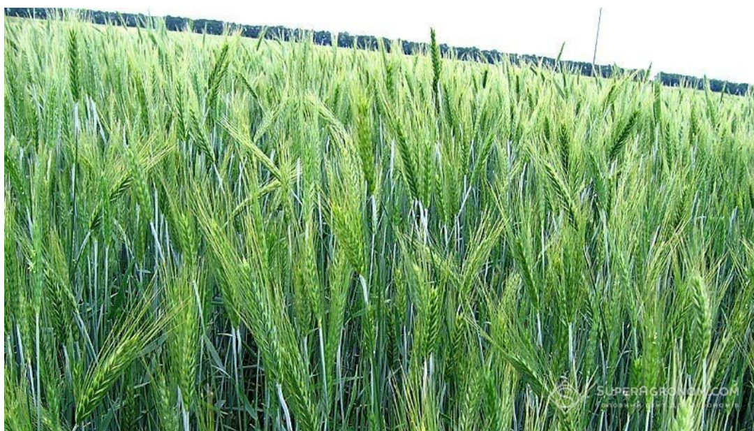
Рисунок 1.1 – Посіви тритикале

Тритикале є штучно створеною зерновою культурою, отриманою шляхом схрещування пшениці та жита. Вона поєднує високу продуктивність і якість зерна пшениці зі стійкістю жита до несприятливих умов вирощування. Завдяки високому вмісту білка, незамінних амінокислот, добрій посухо- та морозостійкості тритикале набуває все більшого поширення в сільськогосподарському виробництві України.