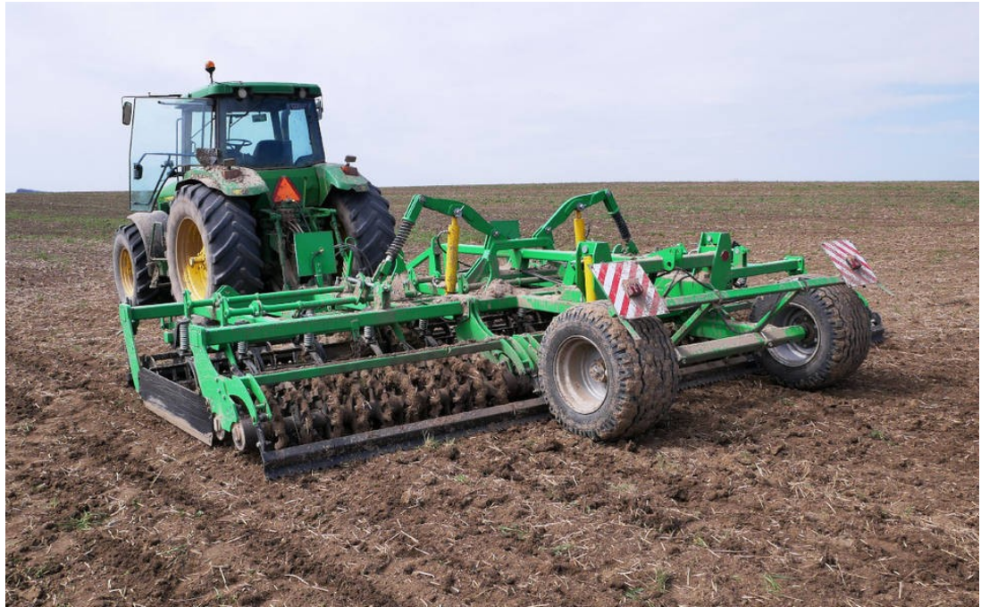
Рисунок 1.4 – Комбінований агрегат типу компактор FORWARD 5

Сучасні комбіновані агрегати дозволяють за один прохід розпушувати, вирівнювати та ущільнювати ґрунт, що підвищує якість підготовки поля до сівби.