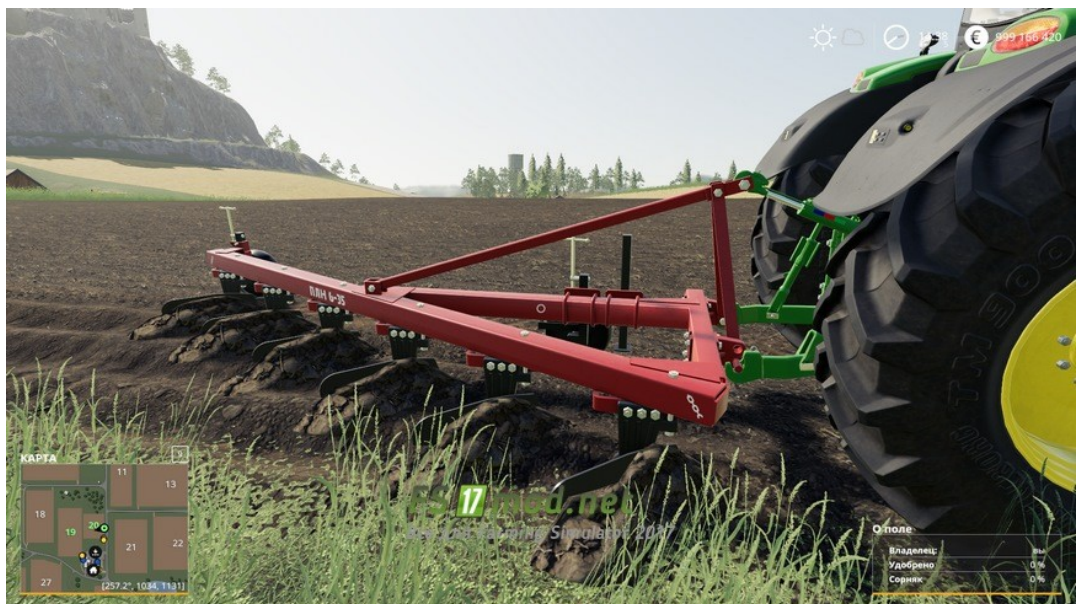
Рисунок 1.2 – Основний обробіток плугами загального призначення ПЛН-6-35

Як енергетичні засоби застосовують трактори потужністю 120–300 к.с., зокрема трактори МТЗ-1221, ХТЗ-17221, John Deere, New Holland, Case IH та інші.