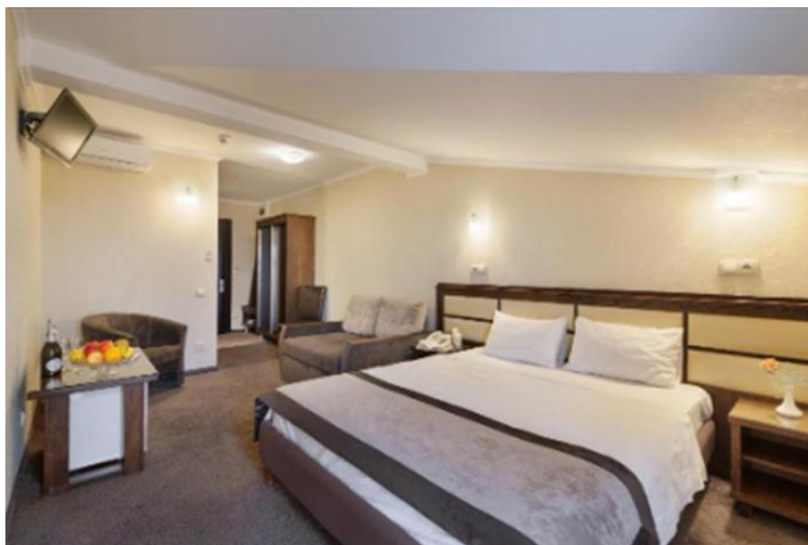
Рис. В.1. Апартаменти ГРК «Avalon Palace»