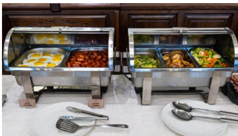
Рис. Б.1. Ресторан та меню ГРК «Avalon Palace»