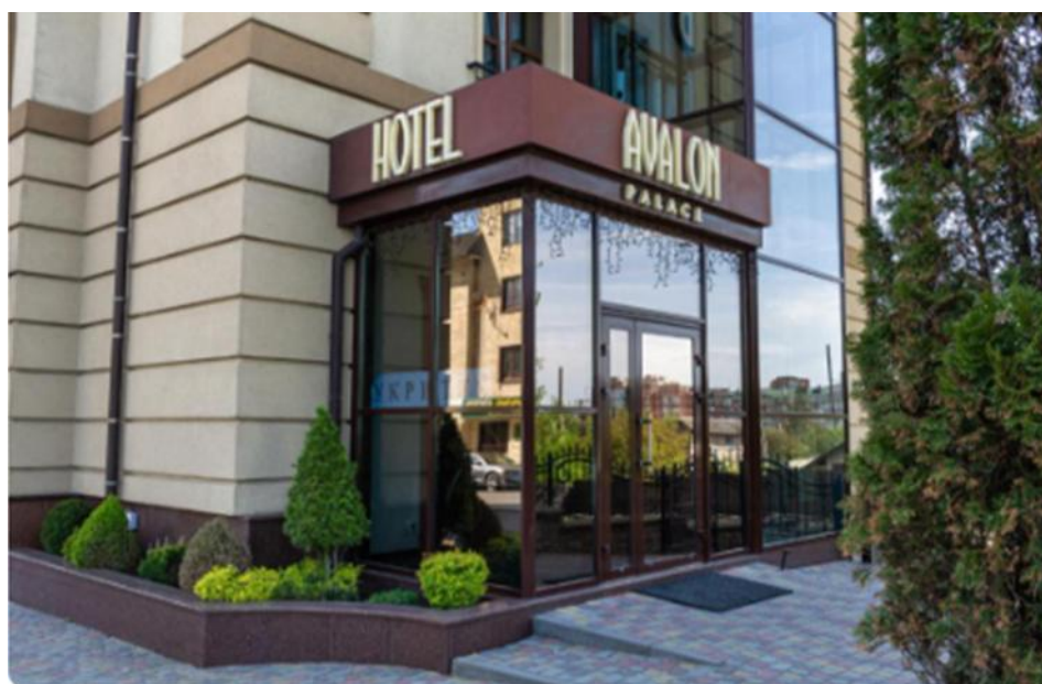
Рис. А.1. ГРК «Avalon Palace»