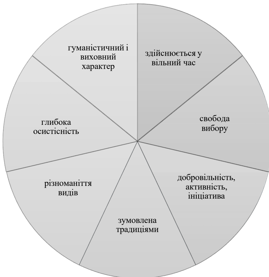
Рис. 1.1. Особливості анімації

Аналіз історії дослідження анімації з позицій її виховного значення дає підстави виокремити два основні етапи її розвитку. Перший етап — друга половина ХХ століття (після Другої світової війни), що характеризується офіційним визнанням ролі анімації як ефективного засобу подолання наслідків соціальної кризи. Другий етап — початок ХХІ століття — пов'язаний із розвитком анімації як соціально-виховного інструменту, розширенням форм анімаційних програм, орієнтованих на формування толерантності, взаємодопомоги, відповідальності, передусім серед молоді. Передумови виникнення анімації узагальнені на рисунку 1.1.