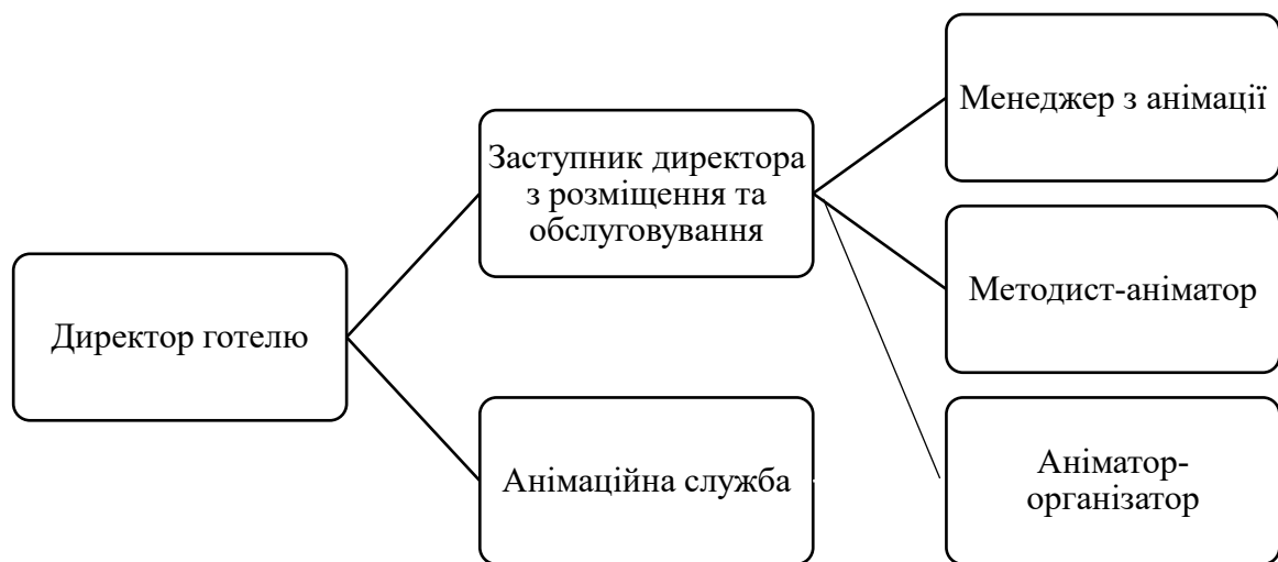
Рис. 3.1. Організаційна структура анімаційної служби ГРК «Avalon Palace»

На початковому етапі функціонування анімаційної служби її структура не повинна бути надто складною чи чисельною, оскільки обсяги анімаційної діяльності прогнозуються помірними. Оптимальним варіантом для ГРК «Avalon Palace» є компактна організаційна структура, що забезпечить ефективну координацію роботи персоналу та можливість поступового розвитку анімаційного напрямку.