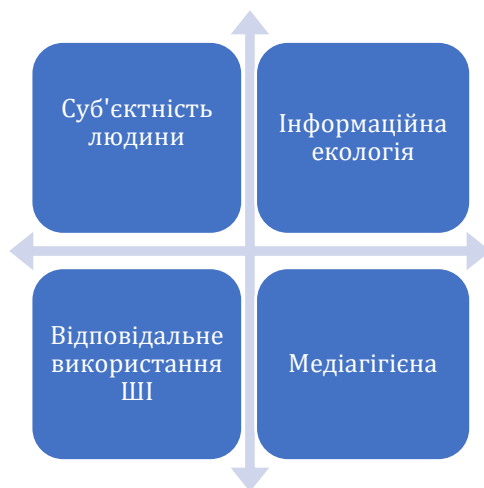
Рис. 1. Структурні компоненти етичного нарративу інформаційного поля соціальних комунікацій