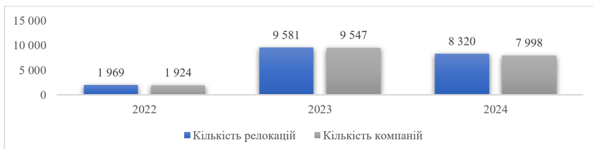
Рисунок 1. Кількість релокацій підприємств по Україні впродовж 2022–2024 рр., од.

Наразі істотним викликом є також мобілізація персоналу та релокація підприємств (рис. 1).