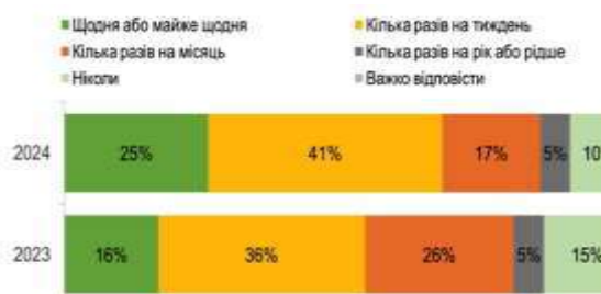
Рис. 1. Динаміка зміни інтенсивності читання серед дітей [2]

Доволі часто читання книжок у вільний час у дітей асоціюється з примусом, завдання з школи, змушують батьки. Але на сучасному етапі зростає частка дітей, які читають за власним бажанням, за досліджуваний період частка таких дітей зросла на 13% і становила у 2024 р. 52%, на 9% знизилась частка дітей, які читають з примусу (рис. 2) [2].