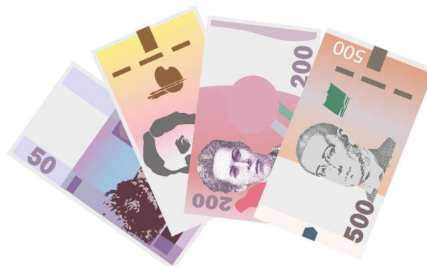
Рис. 1. Настільна фінансова гра «Мій бюджет»