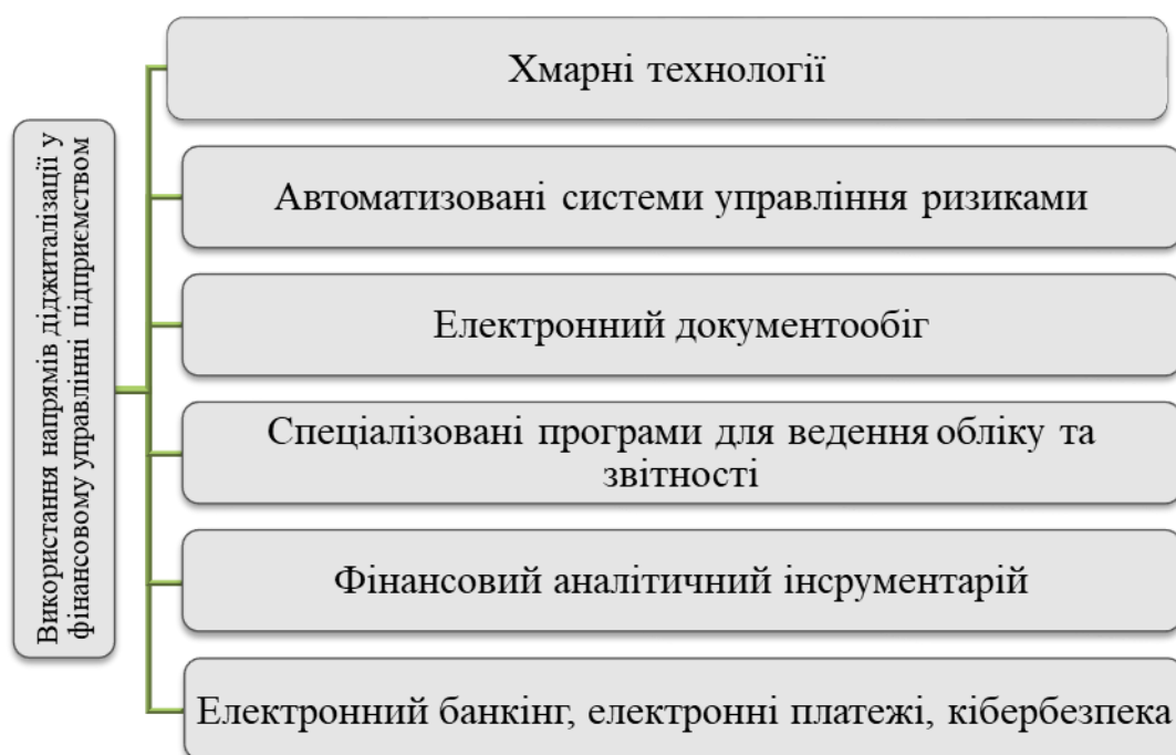
Рисунок 1. – Використання напрямів розвитку діджиталізації у фінансовому управлінні підприємством (сформовано авторами на основі [1])

Науковець Захарова Н. зазначає, що на діяльність підприємств на сучасному етапі також значний вплив має розвиток діджиталізації (рис. 1).