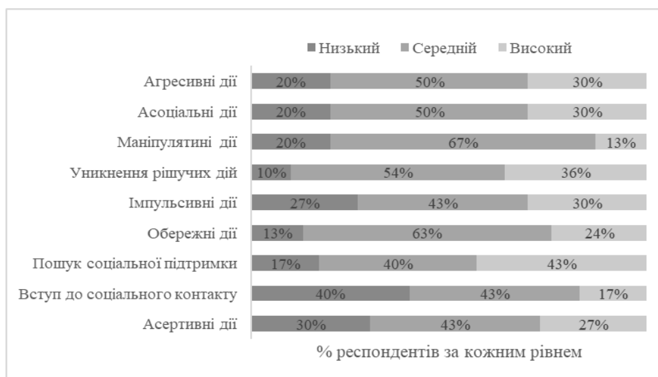
Рис. 2. Результати методики «Стратегії подолання стресових ситуацій» С. Хобфолла

Дослідження стратегій подолання стресових ситуацій соціальних працівників представлені на рис. 2.