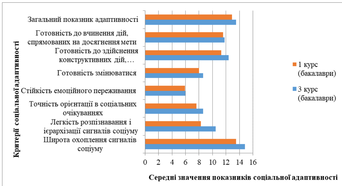
Рис. 1 – Розподілу студентів 1 і 3 курсів за показниками соціальної адаптивності

За результатами дослідження переважна більшість студентів у цілому позитивно ставиться до себе. Показники особистісної тривожності у бакалаврів-першокурсників відсутні, незначне підвищення у студентів третього курсу зумовлене тим, що виникають ситуації оцінки їх компетентності.