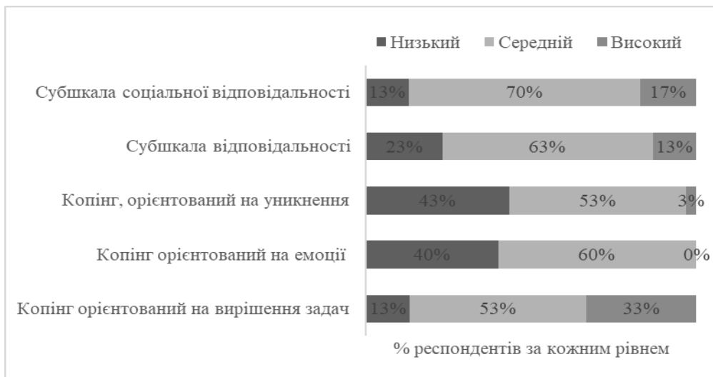
Рис. 1. Результати методики «Копінг-поведінка у стресових ситуаціях» С. Нормана, Д. Ендлера, Д. Джеймса, М. Паркера (в адаптації Т. Крюкової)

У 53% респондентів за шкалою «копінг, орієнтований на вирішення задач» виявлено середній рівень прояву. За шкалою «копінг, орієнтований на емоції» виявлено високий (40%) та середній (60%) рівні вираженості. Відповідно до шкали «копінг, орієнтований на уникнення», ми можемо стверджувати, що найвищі результати вираженості притаманні середньому рівню (53%). Субшкала відповідальності представлена у респондентів на середньому (63%) та високому (23%) рівнях, субшкала соціальної відповідальності – у переважачої більшості на середньому рівні (70%).