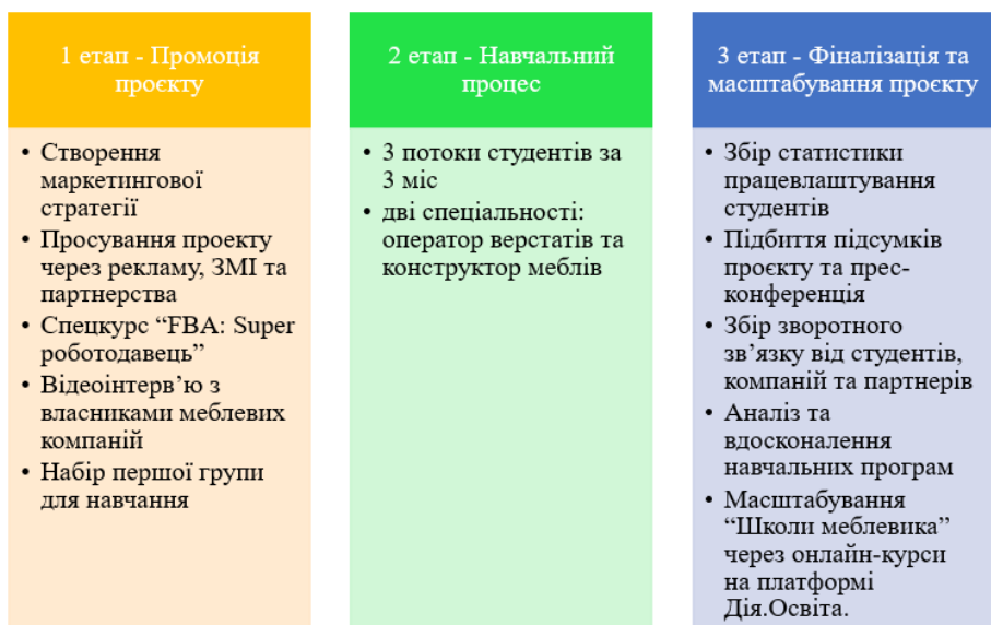
Рис. 3. Реалізація проекту «Школа меблевика» [1].

Уваги кожного власника меблевої компанії заслуговує спеціальний курс FBA: Super роботодавець, який дозволить підприємцю покращити свою конкурентну позицію на ринку праці, бути більш привабливим серед роботодавців та забезпечити відмінні умови праці для залучених фахівців. Участь суб'єкта господарювання у даному спецкурсі дасть змогу йому перетворити свою компанію на магніт для найкращих талантів. Адже, для процвітання меблевої індустрії, професіоналами повинні бути, як працівники, так і їх керівники. Окрім цього, з керівниками меблевих установ доцільно провести тематичні відеоінтерв'ю для популяризації меблевої професії. Акцент слід зробити на налагодженні партнерських відносин з управлінцями меблевих установ з метою проведення стажувань та працевлаштування випускників.