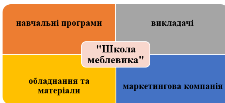
Рис. 2. Функціональне застосування проєкту «Школа меблевика» [1]

Проєкт «Школа меблевика», крім ліквідації кадрового дефіциту у меблевій сфері, сприятиме працевлаштуванню випускників. На нашу думку, такий крок у HR – менеджменті також носить соціальну складову, адже дозволить дещо знизити рівень безробіття у країні. Функціональне застосування даної концепції можна зобразити на рис. 2.