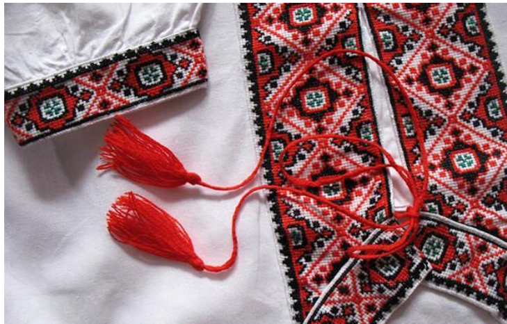
Рис. 1. Традиційний орнамент вишиванки