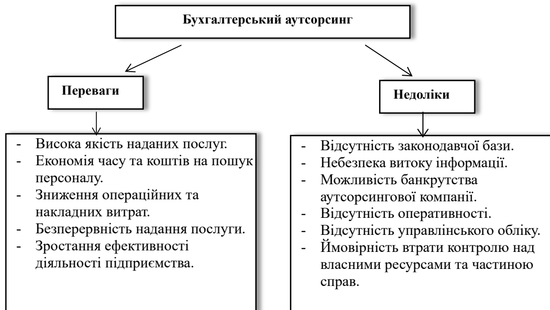
Рисунок 2. Основні переваги та недоліки бухгалтерського аутсорсингу

можна виділити: скорочення витрат підприємства, пов'язаних з утриманням бухгалтерської служби, а також збільшення вільного часу і ресурсів, які будуть використані для підвищення результативності комерційної діяльності підприємства.