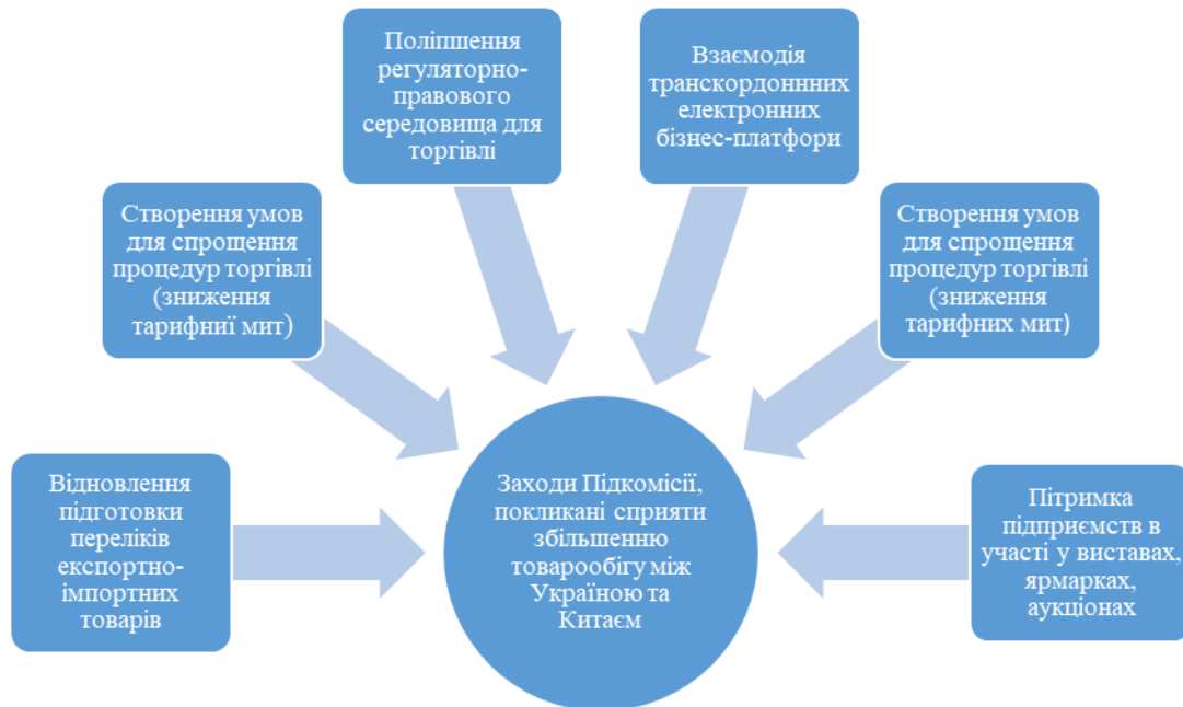
Рисунок 3. Заходи Українсько-китайської Підкомісії з питань торговельно-економічного співробітництва, що мають сприяти збільшенню товарообігу між Україною і КНР

Діяльність Підкомісії з торговельно-економічного співробітництва між Україною та КНР є надзвичайно важливою [6]. Наразі відбулося шість засідань Підкомісії. Мета їх полягає в тому, щоб розробити конкретні заходи, які сприятимуть збільшенню товарообігу між державами, подоланню негативних тенденцій у торгово-економічному співробітництві, лібералізації торгівлі, диверсифікації товарів і послуг, а також визначити проекти для спільної реалізації в галузях агробізнесу, інфраструктури, енергетики та енергозбереження (рис. 3).