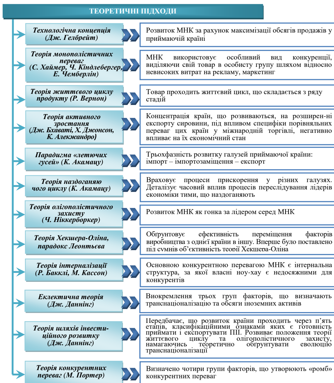
Рисунок 1. Узагальнення теоретичних підходів до проблем виникнення МНК

Теоретичне підґрунтя транснаціоналізації світового господарства представлено на рис. 1.