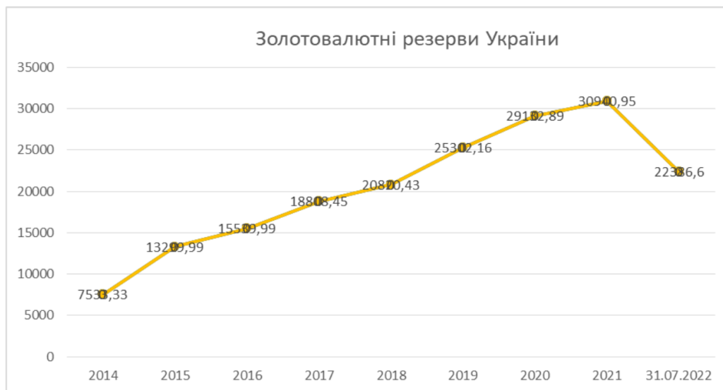
Рисунок 3. Динаміка золотовалютних резервів України за 2014–2022 роки, млн дол США [16]

Україна має запас міцності у вигляді золотовалютних резервів. Війна вимагає значних затрат. Динаміка золотовалютних резервів України, починаючи з 2014 року, року вторгнення російської армії на українські землі, наведена на рис. 3.