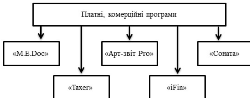
Рис. 2. Платні програми для подання електронної форми звітності

Також є платні, комерційні програми, в яких є можливість не лише подавати звітність в контролюючі органи, а й повністю вести електронну документацію і обмінюватись нею з контрагентами (рис. 2).