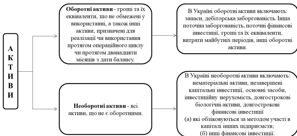
Рис. 1. Склад активів підприємства згідно з НП(С)БО 1 «Загальні вимоги до фінансової звітності»

Управляючи своїми активами підприємство визначає необхідність попередньої їхньої класифікації, зокрема за характером участі у господарському процесі та швидкості обороту на оборотні та необоротні активи [5, с. 501]. Склад активів підприємства відображено на рис. 1.