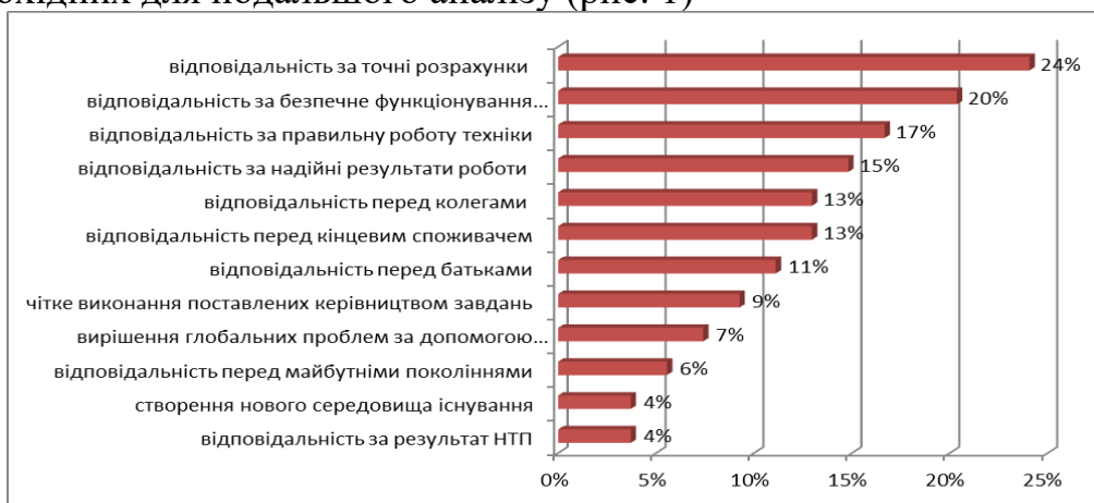
Рис. 1. Визначення респондентами змісту професійної відповідальності фахівців технічного профілю

На другому етапі визначено кількісні одиниці аналітичного дослідження – одиниці контексту та одиниці обрахунку. Спочатку текст був прочитаний в повному обсязі, що необхідно для формування загального враження, перш ніж він буде сортуватись за фрагментами. Повторно, більш детально перечитувались опитувальні листи, наші попередні коментарі переосмислювались та співставлялись з контекстом ситуації та розумінням конкретним студентом змісту професійної відповідальності фахівців технічного профілю. У процесі наступного читання формувалися коди, коментарі укрупнювались, та одночасно відбулося скорочення тексту досліджуваного опитувального листа за рахунок виключення непотрібної інформації; в подальшому коди уточнювались, конкретизувались, співвідносились з конкретними уривками тексту. У результаті аналітичного опису залишився організований структурований текст та всього декілька категорій і уривків з нього, необхідних для подальшого аналізу (рис. 1)