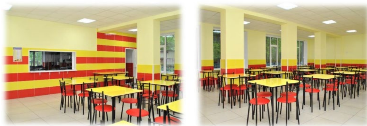
Рис. 4. «Супер-їдальня» Комунального закладу «Роганський академічний ліцей» (відзнака Регіонального баттлу «Супер-їдальня») [6]

Комплексний підхід до прийняття управлінських рішень відмічається і такими відзнаками як диплом Регіонального баттлу «Супер-їдальня», який отримала їдальня Комунального закладу «Роганський академічний ліцей» (рис. 4).