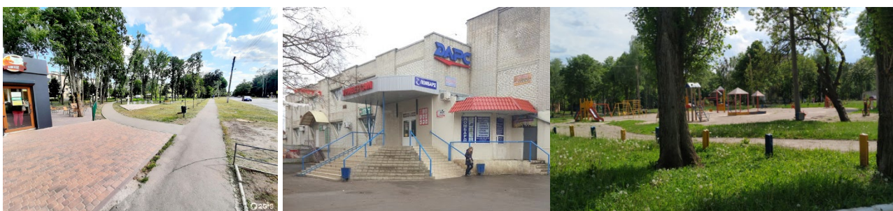
Рис. 5. Об'єкти надання повсякденних послуг

Осучаснюються існуючі об'єкти надання повсякденних послуг та створюються нові, які забезпечують нові робочі місця (рис. 5).