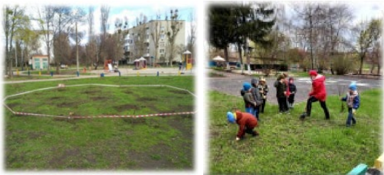
Рис. 1. Заходи з озеленення та благоустрою населених пунктів [6]

Яскравим прикладом розвитку новостворених об'єднаних територіальних громад є процеси та результати вкладання сил та коштів на благоустрій території (рис. 1, 2). Так, за даними звіту Роганського селищного голови [6] можна відмітити значну увагу яка приділяється в громаді питанням благоустрою території, і про це свідчать не лише цифри наведені у звіті (стор.66-69), а й постійні поліпшення, які здійснюються, і завдяки яким громада розвивається та стає потенційно привабливою для інвесторів. За останні декілька років з'явилися зручні тротуари на центральних вулицях громади в кварталах індивідуальної присадибної житлової забудови (рис. 2).