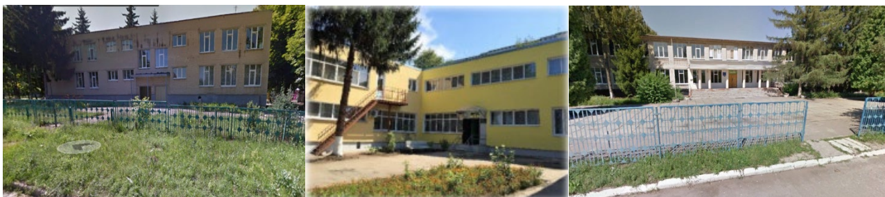
Рис. 3. Заклади освіти громади

У громаді сформована та збережена на 100% мережа освітніх закладів, які створюють достатні умови для розвитку та навчання дітей (рис. 3).