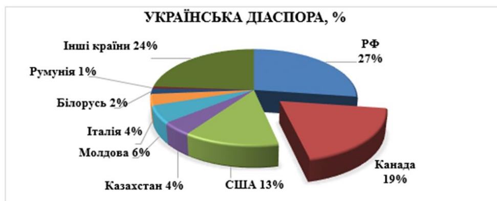
Рисунок 4. Структура утворених найчисельніших українських діаспор по Світу [6, 2]

Що стосується утворень української діаспори в країнах Світу, найбільше українських громадян зосереджено в країнах Північної та Південної Америки, Європи, Азії, незначна частина – в Австралії. Серед таких країн є РФ – 2058 тис. осіб, Канада – 1468, США – 987, Казахстан – 333, Молдова – 435, Італія – 287, Білорусь – 139, Румунія – 50, інші країни – 1800 тис. осіб.