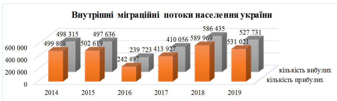
Рисунок 2. Внутрішні міграційні потоки населення України [2]

На сьогодні міграційний потік значною мірою направлений до зростання саме на внутрішній рівень. Українці масово шукають місця заробітку на територіях інших областей та регіонів. Дана ситуація спричинена внаслідок конфлікт в Донецькому регіоні – майже 2 млн. осіб є внутрішньопереміщеними (ВПО), серед яких лише близько 20% працевлаштовані.