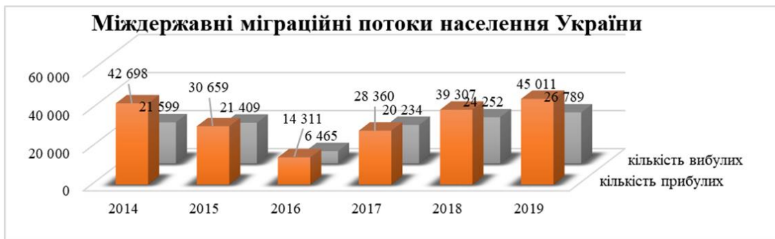
Рисунок 3. Структура міждержавних українських потоків 2014–2019 рр.

Що ж стосується міждержавного переміщення, то українське населення, у порівнянні з періодом до 2014 року, мігрує меншою мірою, хоч і спостерігається зростаюча тенденція.