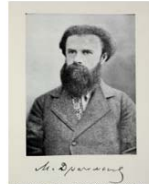
Михайло Драгоманов (дядько Лесі)