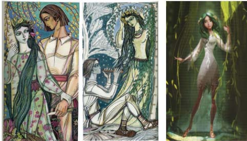
Автор: Софія Караффа-Корбут

Для тренування навичок аудіювання та говоріння пропонуємо завдання комунікативного спрямування на основі проглянутих відео про життя і творчість Лесі Українки.