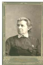
Олена Пчілка (мати Лесі)

Леся любила казки: "Я дуже люблю казки і можу їх відудувати мільйони". "Коли вибрати з двох, то я вже волю бути Дон-Кіхотом ніжє Саччо Пансаї бо так мені більше по натурі, та й навіть по фігурі". Хворобливу і тендітну Лесю Франко назвав "сидним мужчиною в нашому