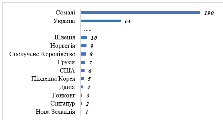
Рис. 2. Позиція України в рейтингу Doing Business порівняно з лідерами за 2020 рік

«забезпечення виконання контрактів» – зменшення з 57 позиції 2019 року до 63 місця за 2020 рік; 4) показник «оподаткування» – отримання 65 сходинок в 2020 році на противагу 54 позиції 2020 року; 5) показник «вирішення питань неплатоспроможності» – зміщення з 145 місця (2019 р.) на 146 сходинку в 2020 році.