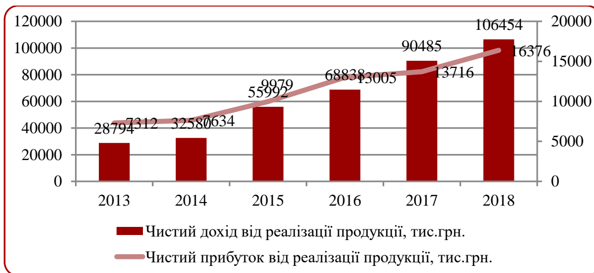
Рисунок 1. Значення чистого доходу та чистого прибутку від реалізації продукції РГ «Підручники і посібники», тис.грн.

Виявлено, що чистий дохід від реалізації продукції за аналізований період (2013-2018 рр.) постійно зростав від рівня 28794 тис.грн. у 2013 році до 106454 тис.грн. у 2018 році. Найбільше абсолютне відхилення значення цього показника було зафіксовано у період 2016-2017 рр., коли воно становило 21647 тис.грн., відносне ж відхилення +71,86 % було досягнуто у 2014-2015 рр.(рис.1).