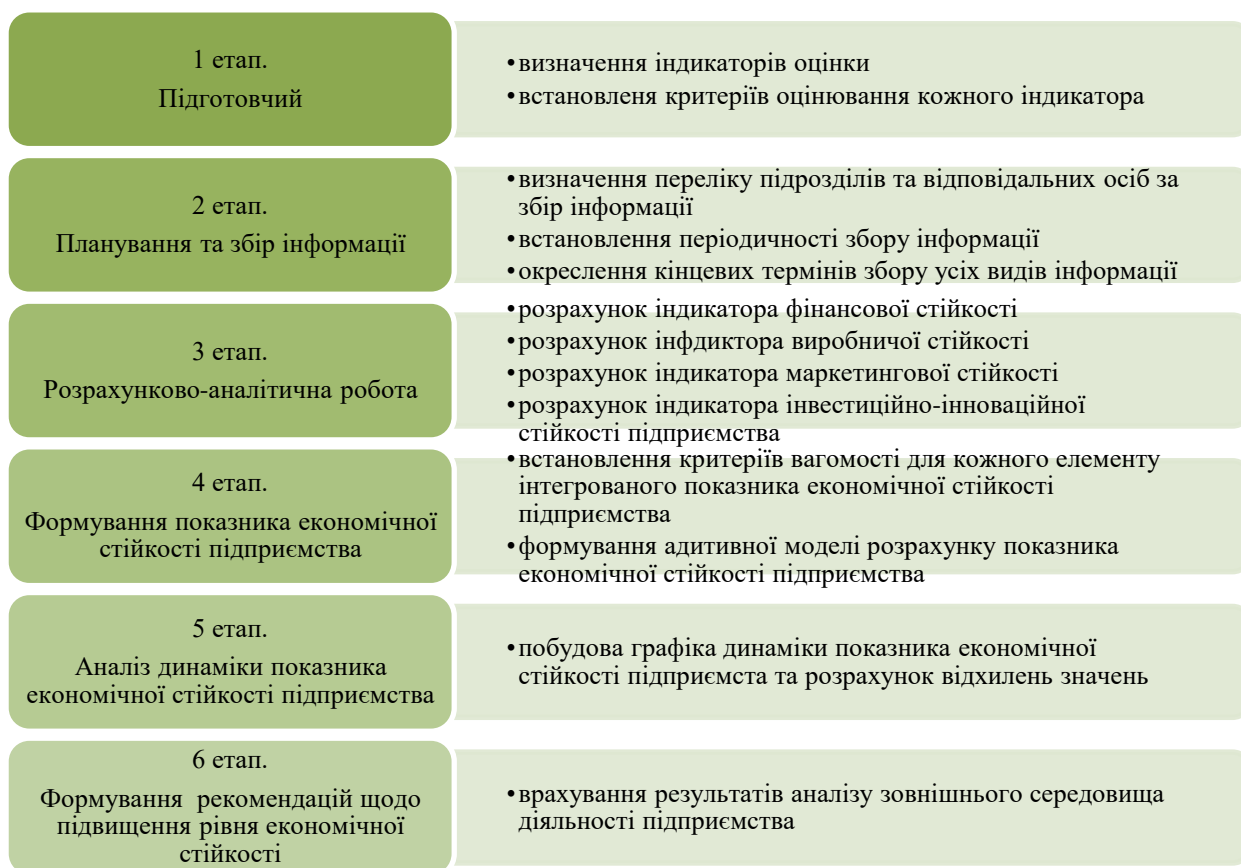
Рисунок 2 Алгоритм проведення аналізу економічної стійкості підприємства

Проведено розрахунки за запропонованим алгоритмом, який показав, що найвищим рівень економічної стійкості був у 2017 році (0,8437), чому передувало 2-х річне зростання. На жаль, 2018 рік характеризувався суттєвим спадом рівня економічної стійкості до показника 2015 року, що вимагає розробки комплексу заходів щодо її підвищення.