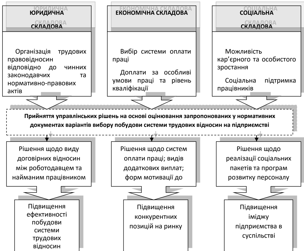
Рисунок 3. Модель побудови трудових відносин на підприємстві

Запропонована модель включає три основні складові: юридичну, економічну та соціальну. Проаналізуємо детально кожен з них.