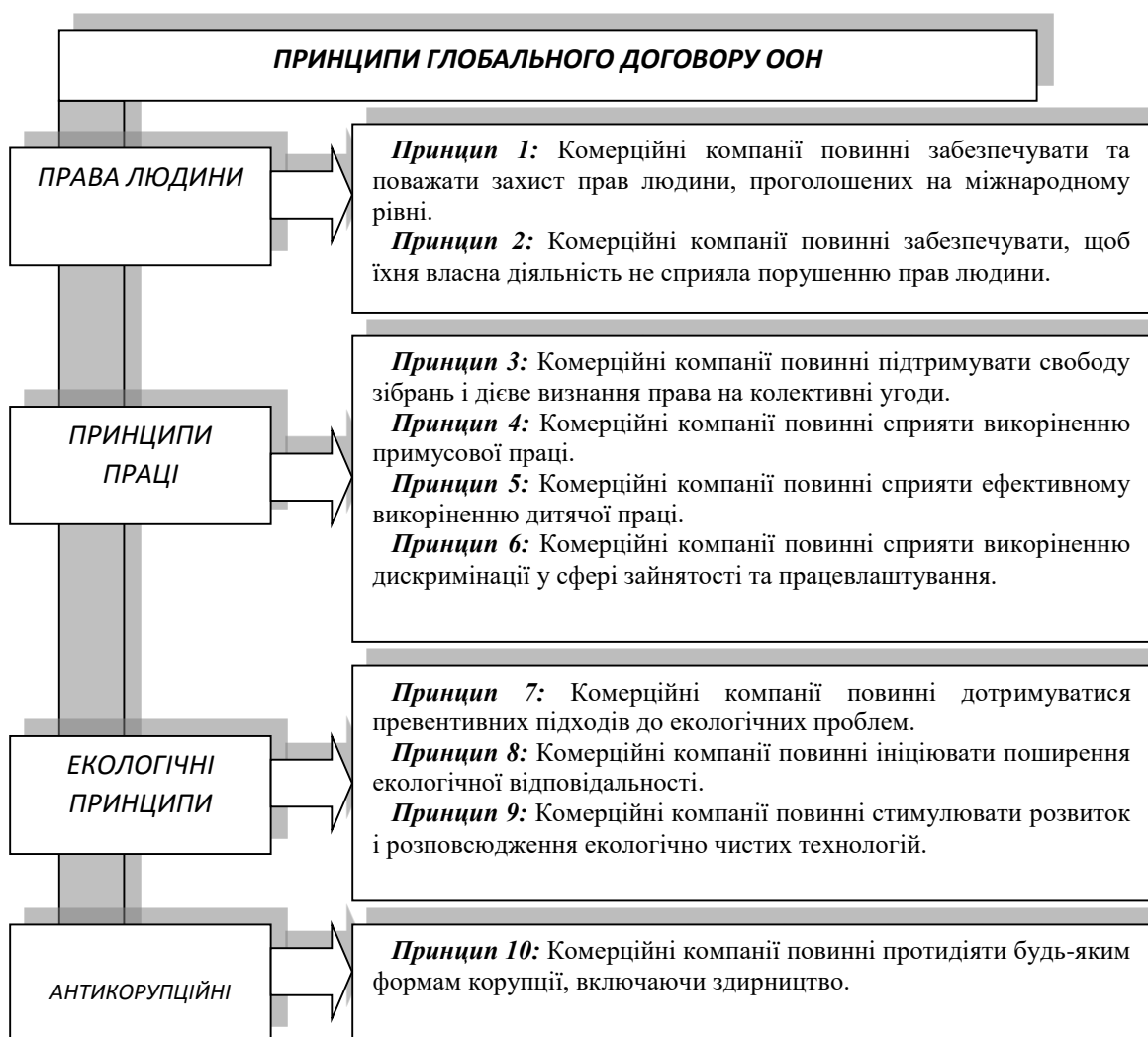
Рисунок 2. Принципи Глобального Договору ООН

Глобальний Договір ООН є добровільною ініціативою, яка об'єднує приватні компанії, агенції ООН, бізнесові асоціації, неурядові організації та профспілки у єдиний форум задля сталого розвитку через відповідальне та інноваційне корпоративне лідерство. Десять універсальних принципів Глобального Договору орієнтовані на втілення практик відповідального бізнесу у сферах прав людини, стандартів праці, екологічної відповідальності та боротьби з корупцією.