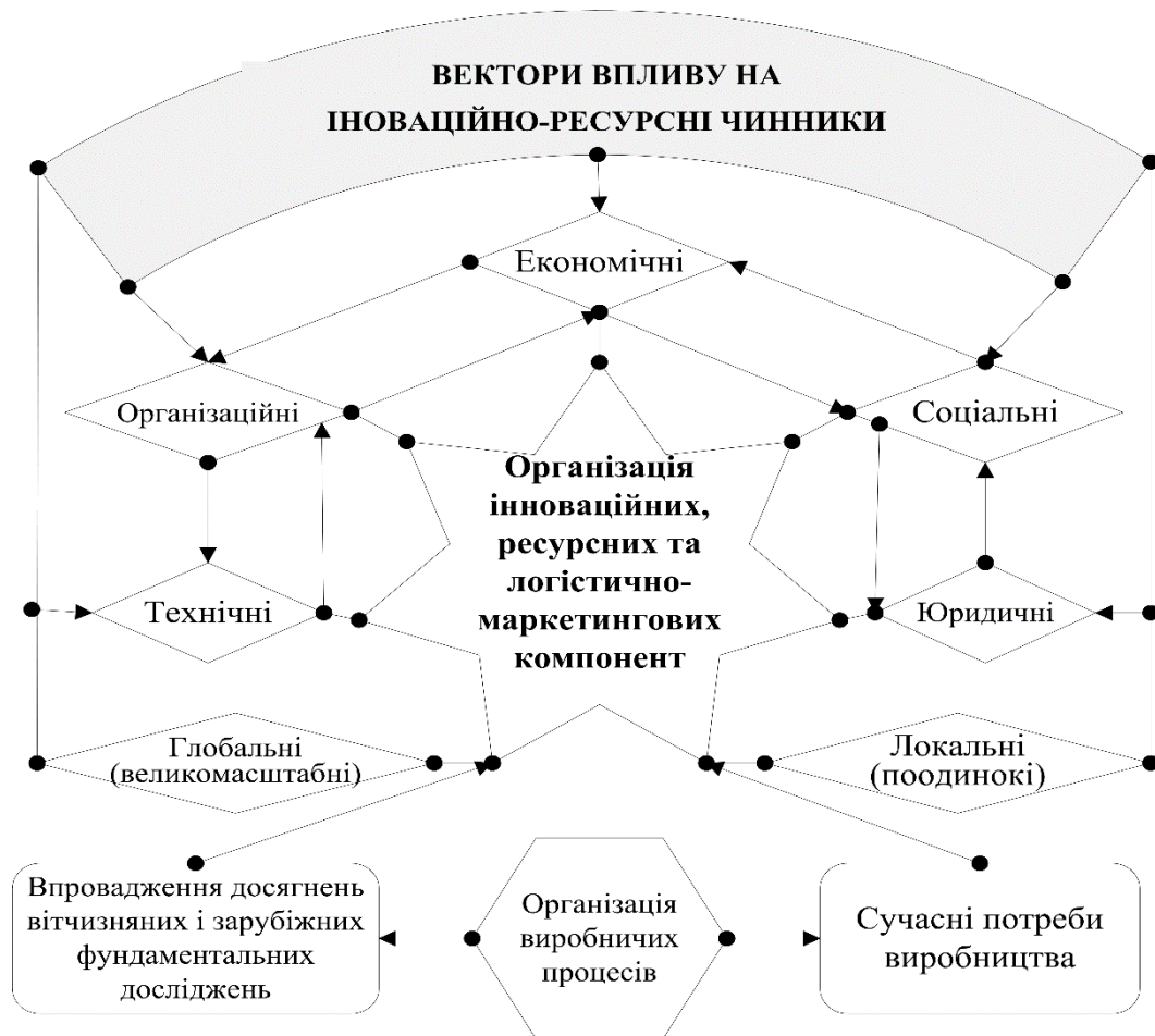
Рисунок 2. Організація процесу забезпечення ефективності економічних реформ та адаптації суб'єктів господарювання до Європейських вимог шляхом активізації управління інноваційно-ресурсними чинниками підвищення конкурентоспроможності промислового підприємства

Висновки. В умовах Європейської адаптації вітчизняних суб'єктів господарювання одним з напрямків підвищення ефективності виробничо-господарського потенціалу підприємства є не лише організація процесу забезпечення ефективності економічних реформ за рахунок управління інноваційно-ресурсними чинниками, а й проведення активної політики оновлення виробництва на всіх рівнях і в усіх галузях національної економіки та господарської діяльності. На рівні підприємств – це розроблення, засвоєння, впровадження у виробництво наукомістких видів продукції, технологій, матеріалів і способів економічного господарювання. На рівні галузей – цілеспрямована структурна, інвестиційна та науково-технічна політика. Інноваційні проблеми дослідження виробничо-господарського потенціалу повинні розв'язуватися комплексно, з урахуванням діяльності різних наукових напрямків: економічного, технічного, організаційного, соціального, ресурсного, юридичного та ін. Організація процесу забезпечення ефективності економічних реформ та адаптації суб'єктів господарювання до Європейських вимог шляхом активізації управління інноваційними, економічними, ресурсними та ін. чинниками підвищення конкурентоспроможності промислового підприємства (див. рис. 2).