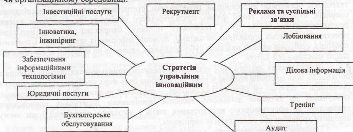
Рис. 1. Зв'язок менеджмент консалтинг з іншими видами професійних, в т.ч. інноваційних послуг

а й прищеплення підходів, методів і розвиток здатностей, необхідних для ефективного застосування знання в конкретному економічному, діловому, інституційному, культурному чи організаційному середовищі.