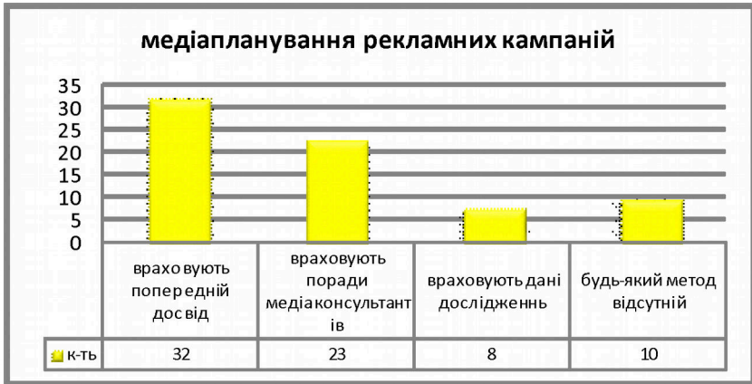
Рис. 6. Медіапланування рекламних кампаній

Визначення ефективності проведених рекламних кампаній та окремо взятих каналів комунікації є досить важким і комплексним поняттям. Це, в першу чергу, пояснюється тим, що вплив реклами на поведінку споживача при купівлі послуги не є одноосібним. Крім реклами на споживача впливає багато факторів і приписати рекламі всі продажі підприємства було б помилкою. Але визначати ефективність рекламних заходів необхідно, в першу чергу, щоб знати чи принесли позитивні зрушення проведені акції.