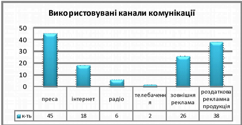
Рис.5. Використовувані канали комунікації

Великий рейтинг довіри, як каналу комунікації припадає на роздаткову рекламну продукцію, що становить 79% від загальної кількості досліджуваних підприємств. Популярністю користується зовнішня реклама, її у своїй практиці використовують 54% від загальної кількості досліджуваних підприємств