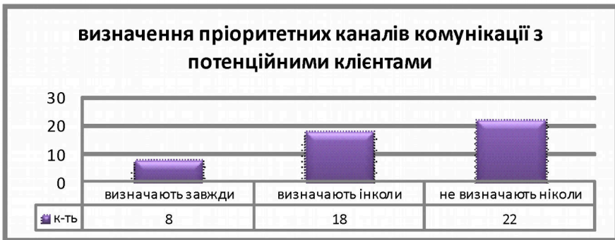
Рис.4. Визначення пріоритетних каналів комунікації з потенційними клієнтами

Успіх рекламної кампанії в значній мірі залежить від правильного вибору каналів розповсюдження рекламної інформації.