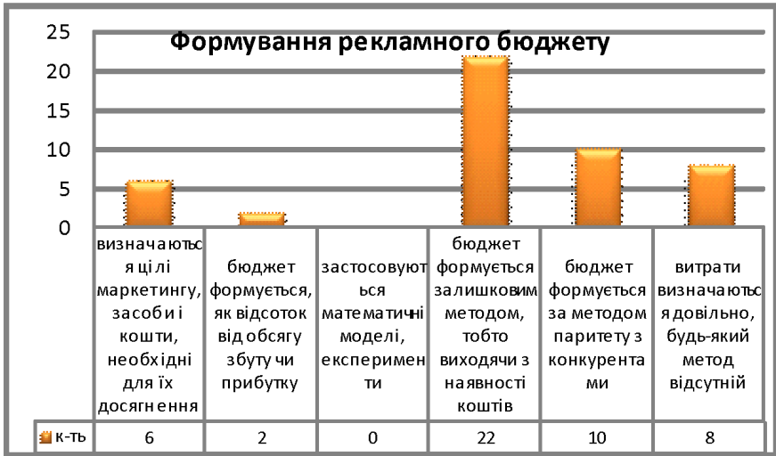
Рис. 3. Формування рекламного бюджету