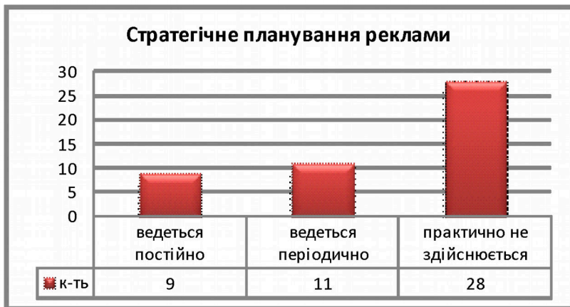
Рис. 2. Стратегічне планування реклами

туристичних підприємствах стратегічне планування реклами ведеться періодично і 58% - його практично не здійснюють.