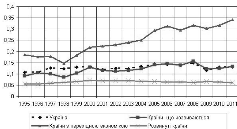
Рис. 2. Динаміка коефіцієнту концентрації експорту України та окремих груп країн, 1995-2011 рр. (од.)

Розрахувавши індекс концентрації експорту за адаптованим показником Херфіндаля-Хіршмана протягом 16 років, ми отримуємо, що його динаміка майже повністю повторює зміну аналогічного показника для країн, що розвиваються (рис.2).