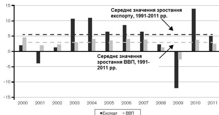
Рис. 1. Зростання в обсягах світової торгівлі товарами та ВВП, 2000-2011 рр. (річна відсоткова зміна)