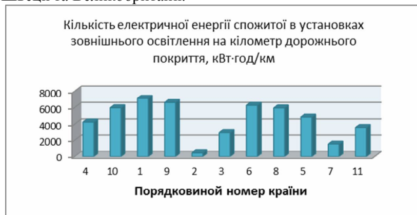
Рисунок 3. Споживання електричної енергії на кілометр дорожнього покриття для зовнішнього освітлення (країни впорядковані відповідно до довжини мережі доріг від меншого до більшого)

На рис. 3 представлено показник кількості електричної енергії спожитої в установках зовнішнього освітлення на кілометр дорожнього покриття для досліджуваних держав. Для України цей показник має середнє значення. Найвищий цей показник для Швеції та Великобританії.