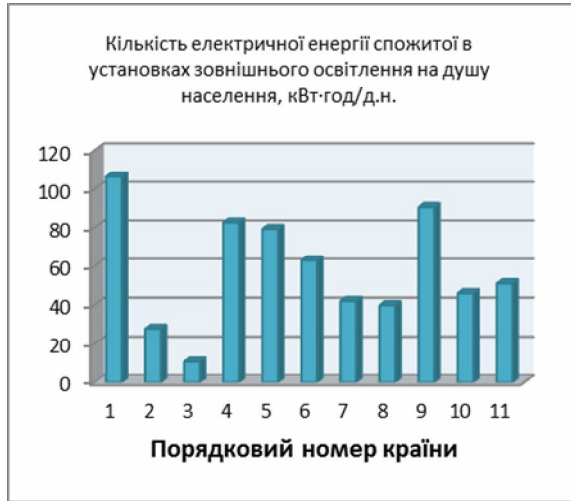
Рисунок 1. Споживання електричної енергії на душу населення для зовнішнього освітлення (країни впорядковані відповідно до щільності населення від меншого до більшого)

Показник кількості електричної енергії спожитої в установках зовнішнього освітлення на кілометр площі території держави не завжди є об'єктивним (рис. 2). В країнах з відносно рівномірним розподілом щільності населення, таких, як Франція, Польща та Нідерланди, як правило, цей показник є гірший, ніж у країнах з великими областями із низькою щільністю населення, таких, як Швеція.