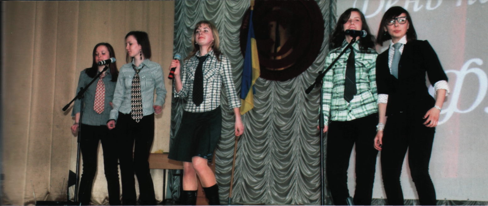
Результати діяльності університету за 2010 рік