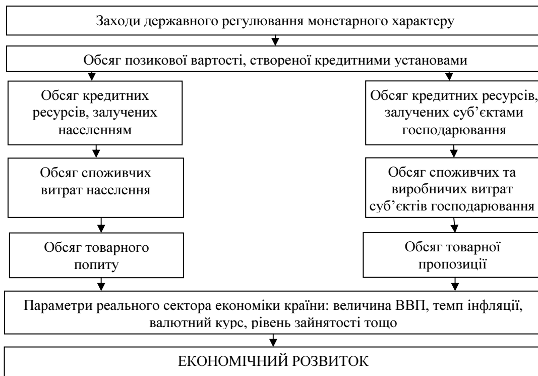
Рисунок 1. Канал банківського кредитування монетарного трансмісійного механізму Figure 1. Bank lending channel of monetary transmission mechanism

Загалом, канал банківського кредитування визначається як механізм впливу діяльності банківських та парабанківських кредитних установ на тенденції економічного розвитку в країні. У більш конкретизованому вигляді канал банківського кредитування пов'язаний з перенесенням банківськими та парабанківськими кредитними установами імпульсів, які створюються в межах механізму державного регулювання кредитних відносин, на обсяги попиту та пропозиції кредитних ресурсів, а також на показники розвитку реального сектора економіки країни (рис.1).