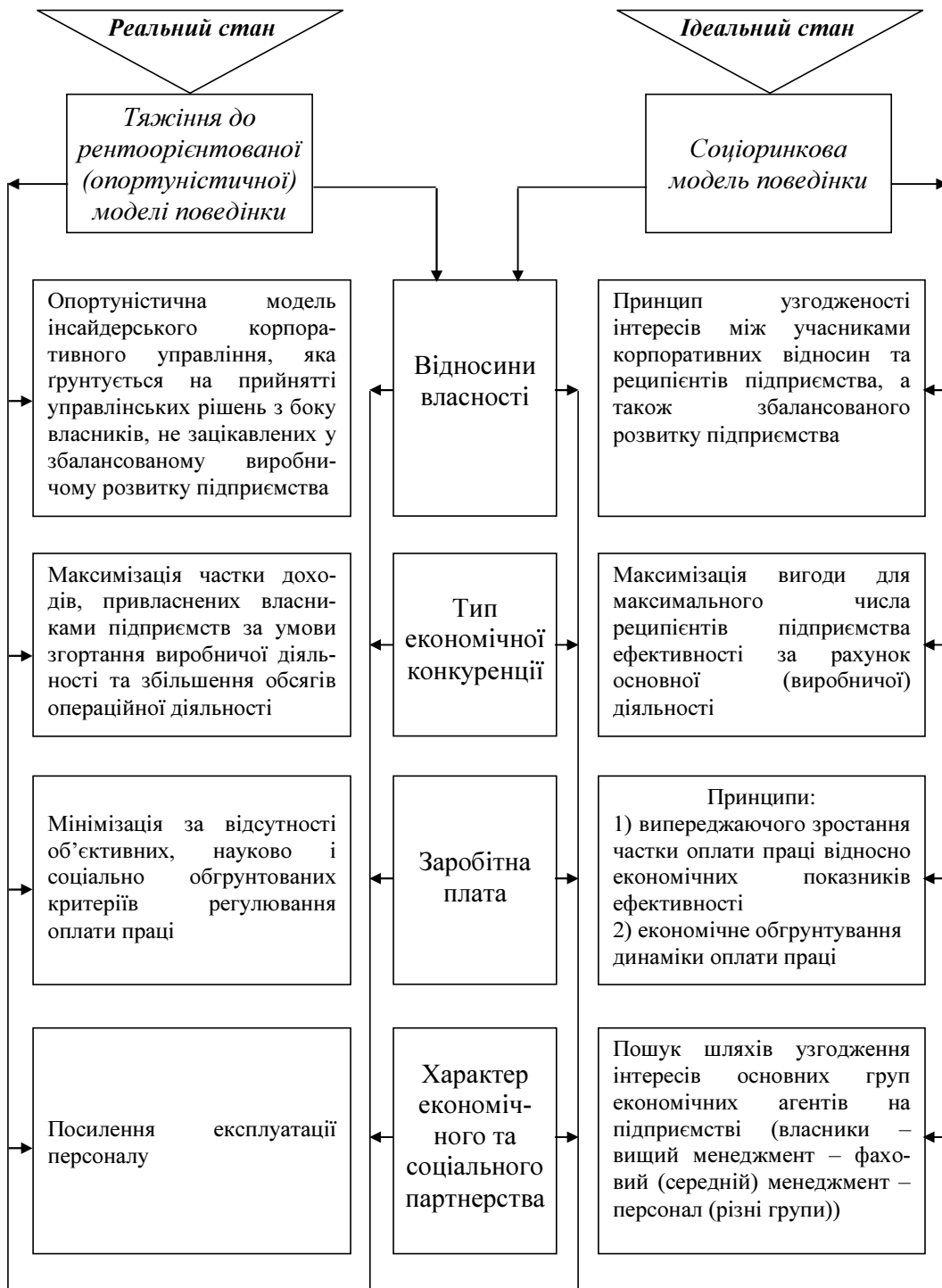
Рис. 3. Мотиваційна модель трансформації соціально-економічної системи підприємства

Таким чином, усі управлінські дії повинні мати опис того, як вони сприятимуть трансформації реального стану до ідеального та відповідних характеристик за всіма чинниками моделі – відносин власності, типу конкуренції, політики оплати праці, характеру соціального та економічного партнерства. Відповідно на початковому етапі регуляції повинні бути зосереджені на чиннику «відносини власності» в інтерпретації видозміни тих дисфункціональних форм корпоративної власності і корпоративного управління, які домінують на даний час в Україні, що означає розроблення низки