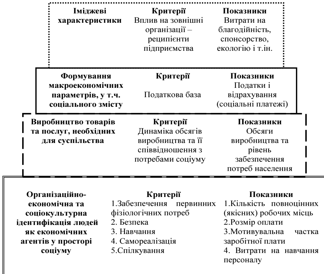
Рис. 1. Концепція ієрархічної ярусності соціальних функцій підприємства

У процесі дослідження ідентифіковано основні підходи до трактування типів економічної поведінки, де соціоповедінковий аспект обрано як методологічно визначальний. Відповідно запропоновано концепцію ієрархічної ярусності соціальних функцій підприємства (рис. 1).