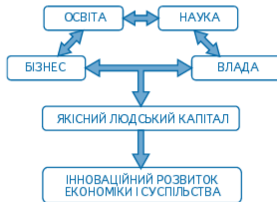
Рисунок 1. Інноваційний розвиток економіки та суспільства України за рахунок активізації людського капіталу

За роки незалежності Україна в багатьох сферах не змогла реалізувати наявний потенціал. Спад виробництва порівняно з 1991 роком становить понад 60%, що порівнюється з втратами Німеччини та Японії за роки Другої світової війни. Відсутність тісних постачальницько-збутових зв'язків України із зовнішніми партнерами, недостатність фінансових ресурсів для розширення матеріальної бази промислового виробництва доводить неможливість за наявних умов переходу на високотехнологічний шлях розвитку. Тому важливо виявити «драйвери» економіки держави та кожного регіону, в основу яких слід покласти якісний людський капітал (рис. 1).