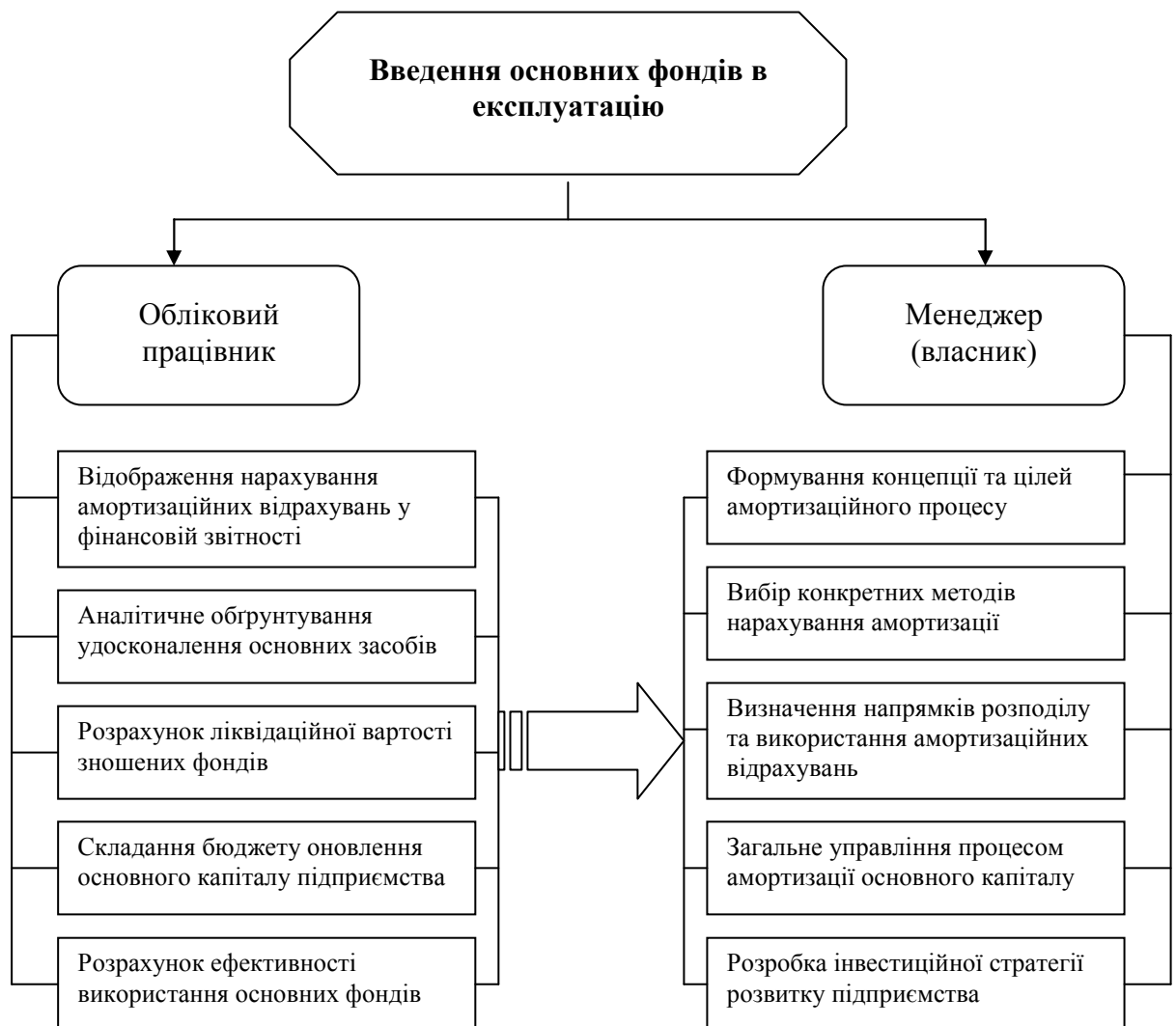
Рис. 3. Розподіл повноважень між обліковцями та менеджерами підприємства у сфері реалізації амортизаційної політики

Враховуючи важливість спеціалізації праці при проведенні амортизаційної політики, пропонуємо здійснити чітке розмежування функції із забезпечення процесу амортизації основного капіталу, яке відображене на рис.3.