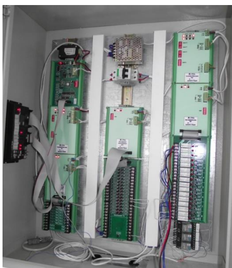
Рисунок 2 - Шафа керування

Розроблений лабораторний комплекс реалізований в лабораторії «Телеметрії та дистанційного керування енергооб'єктами» на кафедрі Систем електроспоживання та комп'ютерних технологій у електроенергетиці і представляє собою макет енергосистеми обласного рівня та використовується при вивченні дисципліни «Системи управління електропостачанням». Тут представлена ієрархія напруг різних класів, диспетчерські пункти керування районними електричними мережами і підстанціями, які об'єднані в загальну систему диспетчерського керування енергосистемою на базі мікропроцесорної техніки останнього покоління з підтримкою сучасних протоколів зв'язку між об'єктами керування. На рис. 2 представлена шафа з каналним обладнанням, яка здійснює телекерування, телесигналізацію та телевимірювання, на рис. 3 – робоче місце диспетчера