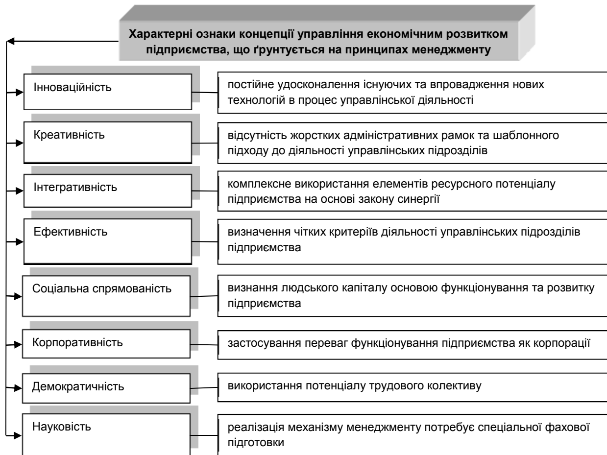
Рис. 1. Характерні ознаки концепції управління економічним розвитком підприємства, що ґрунтується на принципах менеджменту

Підхід до управління економічним розвитком підприємства, що базується на принципах менеджменту, відповідає якісно новим вимогам часу, що наділяє його певними характерними ознаками (рис. 1).