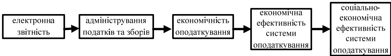
Рис. 4 Взаємозв'язок електронної звітності та показника СЕЕСО

Для підприємств введення електронної податкової звітності сприяє уникненню зловживань з боку податкових інспекцій при поданні та обробці декларацій, веде до економії часу та коштів при поданні звітів, уникнення помилок при заповненні декларації, отримання достовірної інформації щодо змін у оновленні форм податкової звітності.