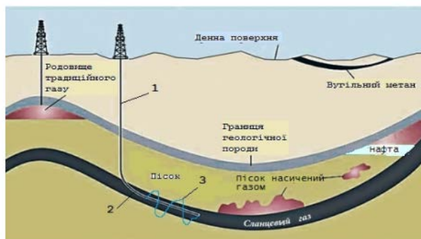
Рисунок 3. Схема технологічних етапів видобутку сланцевого газу: 1 – вертикальне буріння; 2 – горизонтальне буріння; 3 – гідравлічний розрив.

п'яти років експлуатації. Середній вік одної свердловини становить близько 7 років, після чого видобування газу стає економічно невиправданим.