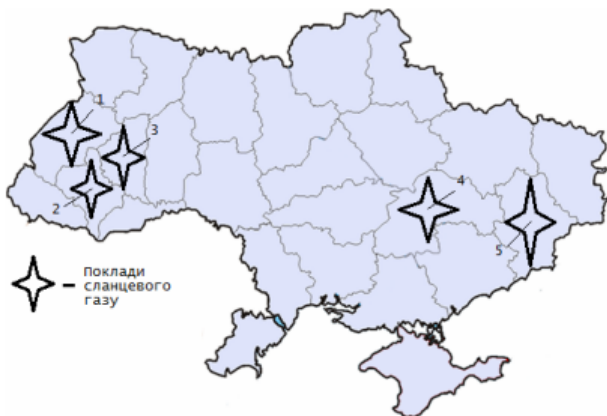
Рисунок 2. – Основні родовища сланцевого газу в Україні по областях: 1 – Львівська; 2 – Івано-Франківська; 3 – Тернопільська; 4 – Дніпропетровська; 5 – Донецька

Технологія видобування сланцевого газу складається із трьох головних етапів: вертикального буріння свердловин до місця розташування газоносного пласта (від 1 до 4 км), горизонтального буріння вздовж газоносного пласта і гідравлічного розриву газоносного пласта в радіусі декількох сотень метрів навколо магістрального горизонтального каналу (рис. 3).