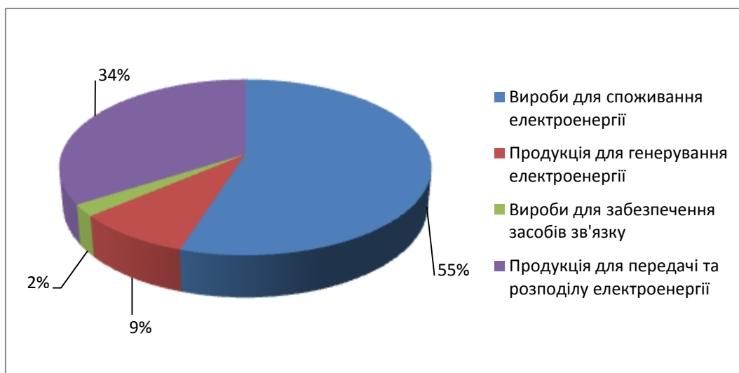
Рисунок 1. Ринок електротехнічної продукції України станом на 2015 рік.[]

Відомо, що саме світовий ринок диктує «правила гри», отже, кожен учасник повинен постійно стежити за тенденціями розвитку як світового, так і вітчизняного ринку, змінами поглядів та побажаннями споживачів.