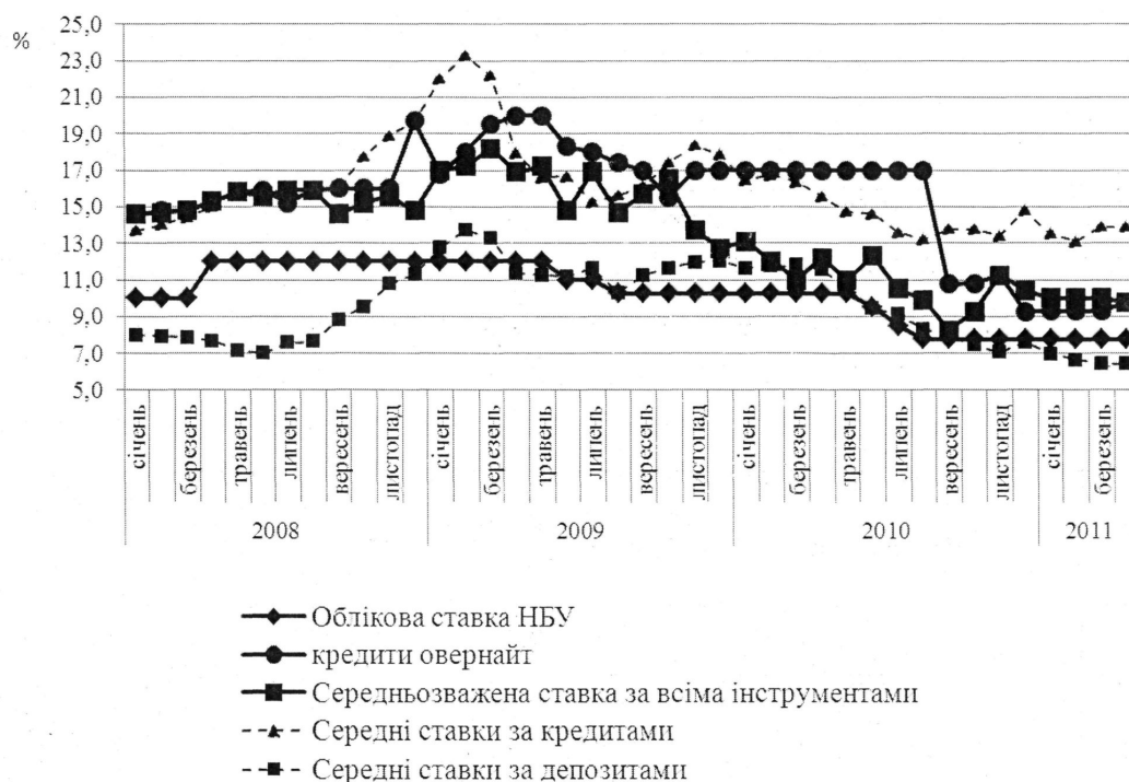
Рис. 2. Процентні важелі впливу фінансової політики на економічну систему України у 2008–2011 рр.