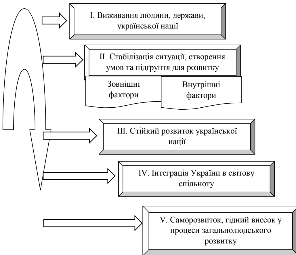
Рисунок 1. Структура національних пріоритетів України

Структура національних пріоритетів, що пропонується (рис.1), покликаний сприяти оптимізації створення та функціонування системи забезпечення реалізації національних пріоритетів. Він визначає, так би мовити, «об'єктивний коридор», у межах якого можуть бути плідно використані суб'єктивні підходи. Таке поєднання забезпечує необхідну обґрунтованість рішень з визначення загроз, створення та функціонування ефективної, збалансованої системи реалізації національних пріоритетів.