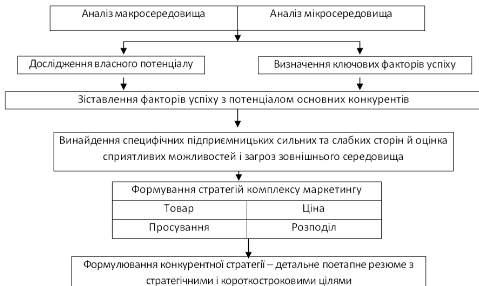
Рис. 3. Принципова схема розробки конкурентної стратегії

Ще декілька років тому на ринку України засобами конкурентної боротьби могли бути окремі елементи маркетингової політики (наприклад, рівень цін, розмір знижок, терміни постачання). По мірі розвитку ринку та поступового переходу до конкурентних відносин сьогодні центр ваги перемістився з кількісних до якісних аспектів (технологічного рівня, якості обслуговування, надійності та ін.), тобто до застосування маркетингу як цілісної системи.