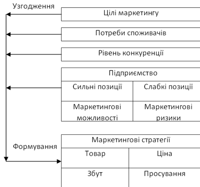
Рис. 2. Чинники, що впливають на процес формування маркетингової стратегії підприємства [2, с. 105]

Більш розширений, з урахуванням етапів, пов'язаних подальшої реалізації конкурентних стратегій даний процес наведений табл. 2. Процес формування конкурентної стратегії повинен мати комплексний характер.