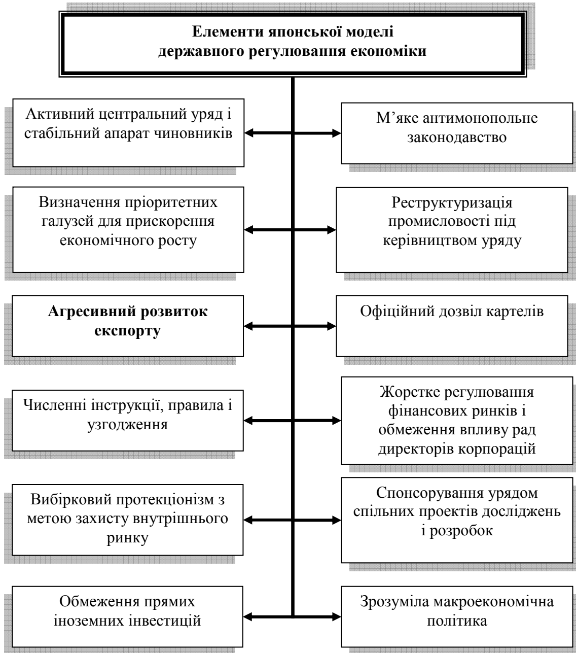
Рис. 1. Японська модель державного регулювання економіки

численні заходи підтримки, в тому числі спеціальні податкові пільги у вигляді прискореної амортизації, яка визначалась пропорційно до обсягів експорту. Крім того, використовувались такі інструменти валютно-кредитного регулювання, як дешеві кредити для розвитку виробництва сировини і комплектуючих, а також здійснювалось фінансування відповідної діяльності за ставками нижче ринкових.