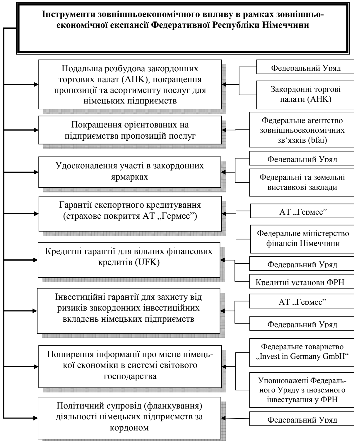
Рис. 2. Інструменти інституціональної підтримки експортної експансії ФРН

У справі підтримки підприємств щодо нарощення їх присутності на зовнішніх ринках та проведенні політики експортної експансії заслуговує на увагу досвід ФРН. На рис. 2 систематизуємо за даними [6] інструменти інституціональної підтримки експортної експансії ФРН. Їх коротка характеристика свідчить про наступне.