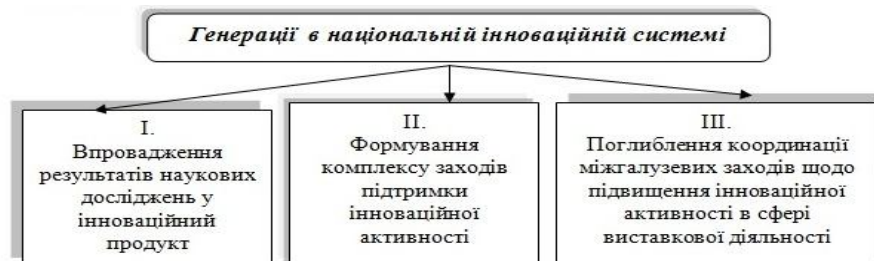
Рис. 1 Генерації в національній інноваційній системі

Генерація ідей – це своєрідний пошук можливостей створення товару ринкової новизни. Ідеї створення нової продукції виникають у дослідницьких лабораторіях та конструкторських бюро в результаті проведення опитувань або аналізу скарг споживачів , спостереження за спорідненими товарами під час виставкових заходів. Основні джерела ідей інновацій: результати аналізу потреб споживачів; результати аналізу розробок у галузі науки і техніки; розробки науково-технічних працівників самого підприємства; результати аналізу діяльності конкурентів; результати ситуаційного й імітаційного моделювання поведінки споживачів у сьогоденні і майбутньому; результати аналізу тенденцій розвитку науково-технічного прогресу та ін. (рис.1).