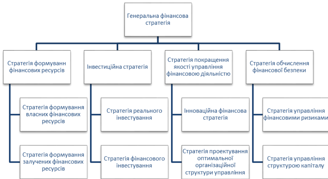
Рис. 1. Класифікація фінансових стратегій

Зазначені напрями, у свою чергу, деталізуються на більш вузькі, з урахуванням досягнення певних фінансових цілей.