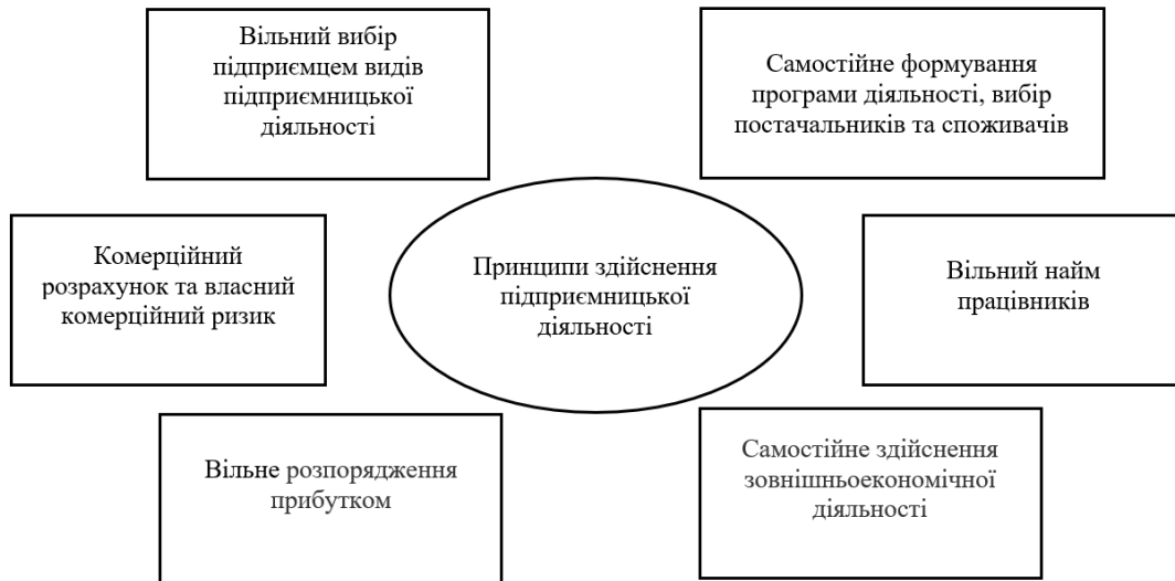
Рисунок 1. Принципи здійснення підприємницької діяльності [2]

Відповідно до Господарського Кодексу України [2]: «...Суб’єктами господарювання є: 1) господарські організації – юридичні особи, створені відповідно до Цивільного кодексу України, державні, комунальні та інші підприємства, створені відповідно до цього Кодексу, а також інші юридичні особи, які здійснюють господарську діяльність та зареєстровані в установленому законом порядку; 2) громадяни України, іноземці та особи без громадянства, які здійснюють господарську діяльність та зареєстровані відповідно до закону як підприємці».