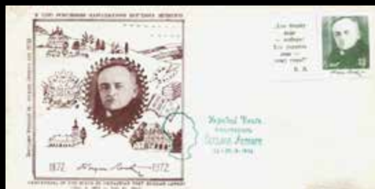
Пам'ятні марки та листівка, випущені до 100-річчя з народження Богдана Лепкого.