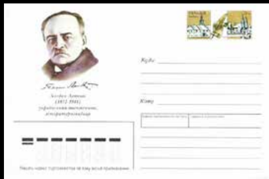
Офіційний конверт та марка «Укрпошти», які були випущені до 100-річчя з народження Богдана Лепкого.

З цього вивченого та описаного матеріалу можна зробити висновок, що творчість Богдана Лепкого радянська тоталітарна система старалася не згадувати й не звертала особливої уваги на його талант. Лише за становлення вільної незалежної України почали гідно вшановувати пам'ятні дати великої постаті, уродженця Тернопільщини (Березанщини).