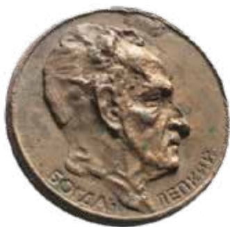
Медаль «Пам'яті Богдана Лепкого».

10 x 40 мм, 23 x 33 мм, кріплення – цанга.