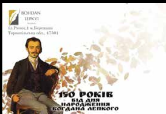
Конверт до 150-річчя з народження Богдана Лепкого. Розроблений для спеціального погашення в Обласному комунальному музеї Богдана Лепкого в м. Березани. Макет марки для конверта заслуженого художника України Олега Шупляка.