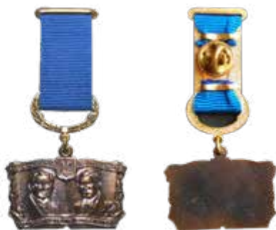
Відзнака «Літературна премія імені Братів Богдана та Левка Лепких».