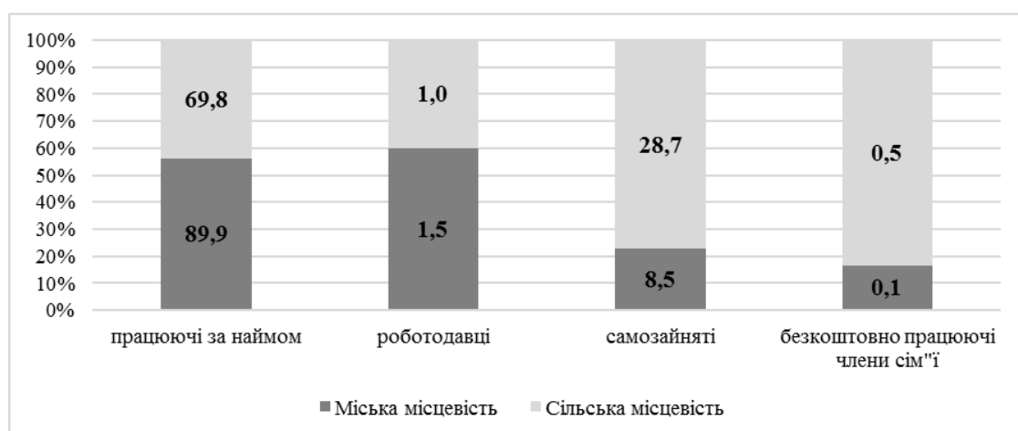
Рисунок 2. Зайняте населення України у віці 15–70 років за типом місцевості й статусом у зайнятості у 2021 році, % [1]

Як бачимо, у вікових групах найактивнішого працездатного населення (25–59 років) рівень зайнятості є вищим у жителів міської місцевості. На сільських територіях рівень зайнятості є вищим лише у молодшій віковій групі (15–24 роки) та найстарших групах населення (старше 60 років). Така диспропорція зумовлює більші проблеми із забезпеченням зайнятості сільського населення саме у сільській місцевості. Відсутність стратегії з вирішення проблем зайнятості загрожує зростанням територіальної мобільності робочої сили, а у певних випадках – ще й професійної мобільності, коли найбільш кваліфіковані працівники сільських територій змінюють місце проживання для отримання вищого рівня оплати праці [8]. Аналогічно варто розглянути структуру зайнятості населення за типом місцевості (рис. 2).