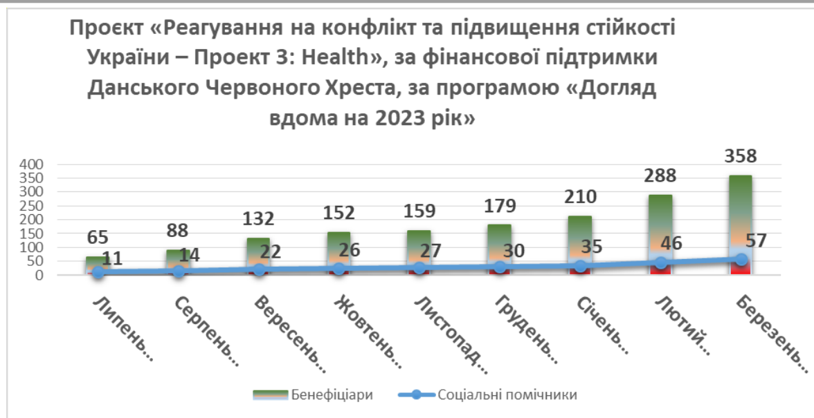
Рисунок 6. Динаміка розвитку Проекту

Волонтери опікуються людьми літнього віку та особами з інвалідністю, які наразі проживають одні й не мають підтримки з боку рідних. Через стан здоров'я такі люди не можуть самостійно забезпечити базові потреби: приготувати їжу, сходити й закупити ліки чи продукти харчування, прибрати приміщення або приготувати страви. Соціальні помічники Товариства Червоного Хреста України допомагають їм у цьому.