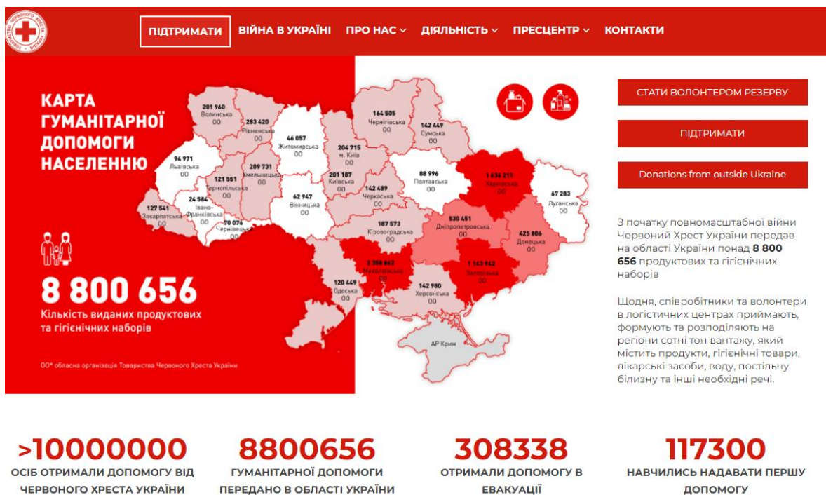
Рисунок 1. Карта гуманітарної допомоги населенню [5]