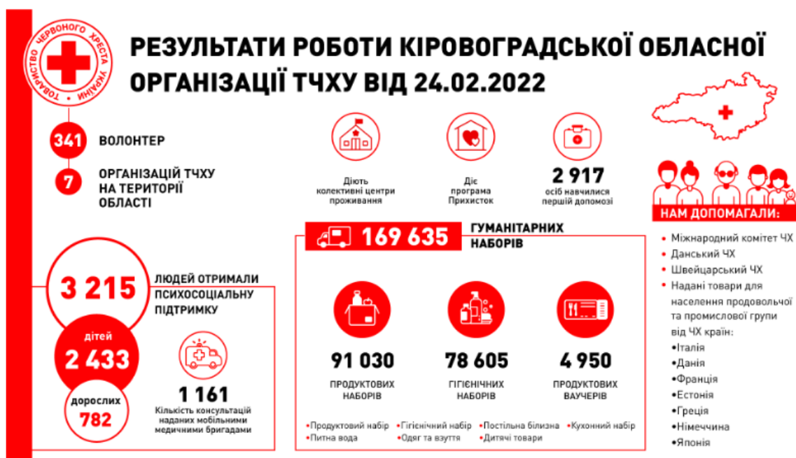
Рисунок 4. Результати роботи Кіровоградської обласної організації ТЧХУ від 24.02.2022 р. станом на 31.12.2022 р. [5]

Кіровоградська обласна організація Червоного Хреста України постійно задіяна у наданні допомоги: проводить навчання з першої допомоги, інформує про мінну небезпеку, першу психологічну допомогу та надає іншу важливу інформацію; приймає, сортує та видає внутрішньо переміщеним особам продукти харчування, медикаменти, одяг, засоби гігієни, підгузки, інші першочергово важливі предмети; допомагає з організацією перевезення людей по Україні; долучає до Червоного Хреста України нових волонтерів.