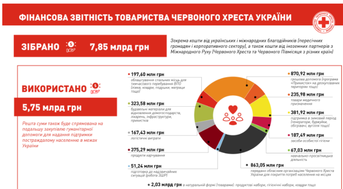
Рисунок 3. Фінансова звітність Товариства Червоного Хреста України [5]

Все викладене вище наочно показує, яку величезну роботу виконують благодійні організації та волонтерські рухи по роботі із соціально незабезпеченими верствами населення України.