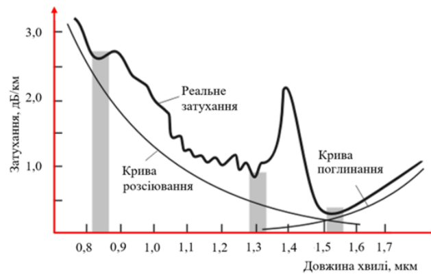
Рис. 2.16. Вікна прозорості оптичного волокна

підвищення кількості каналів до 16, 32 та 40 привело до зміни назви технології на щільне мультиплексування по довжині хвилі (Dense WDM, DWDM ).