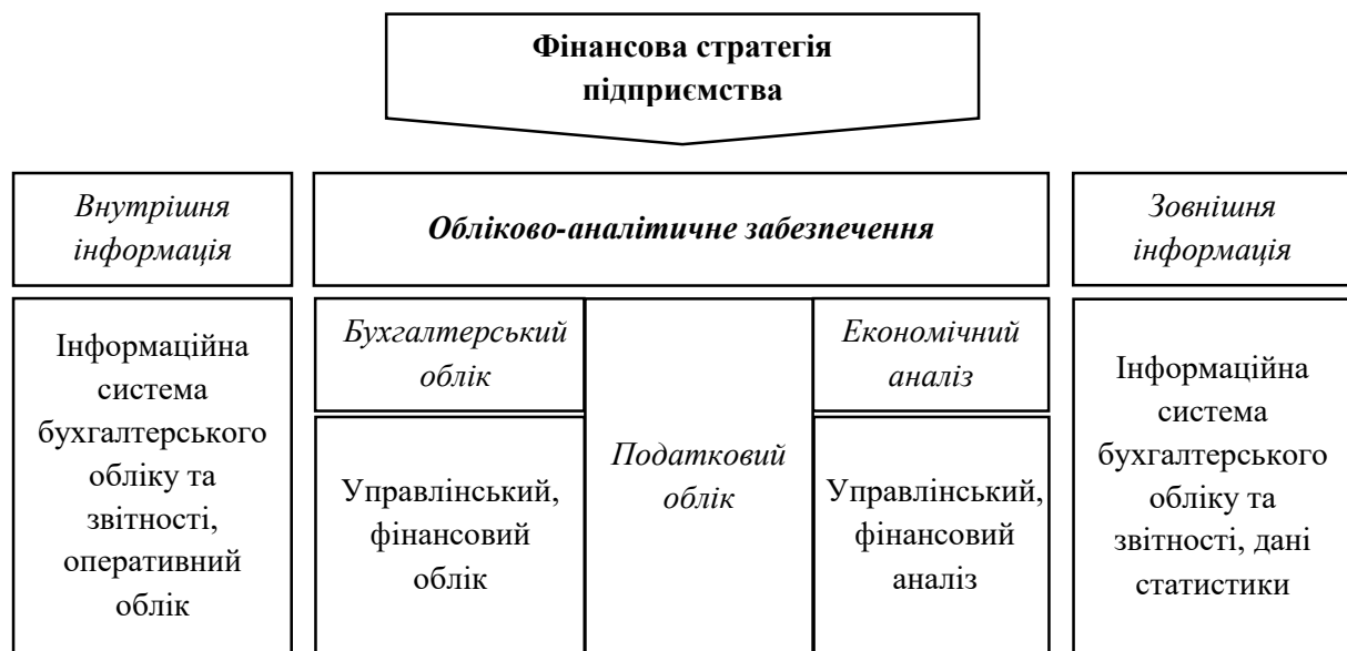
Рисунок 1. Інформаційний взаємозв'язок фінансової стратегії та обліку

На рис. 1 відображений інформаційний взаємозв'язок фінансової стратегії і бухгалтерського обліку. На нашу думку, функція обліково-аналітичного забезпечення повинна реалізовуватися єдиним блоком у складі бухгалтерського обліку, фінансового та управлінського аналізу. В рамках обліково-аналітичного забезпечення відбувається інтерпретація даних інформаційної системи бухгалтерського і статистичного обліку, обґрунтовуються певні аналітичні дані, що становлять основу прийняття управлінських рішень. Зазначений підхід до аналітичного забезпечення фінансової стратегії відображає управлінську природу обліково-аналітичної діяльності, на основі якої може бути аналіз компанії для створення її вартості як очікуваного вільного грошового потоку від операційної діяльності, в якій вже враховані необхідні для розвитку підприємства інвестиції й виплати кредиторам.