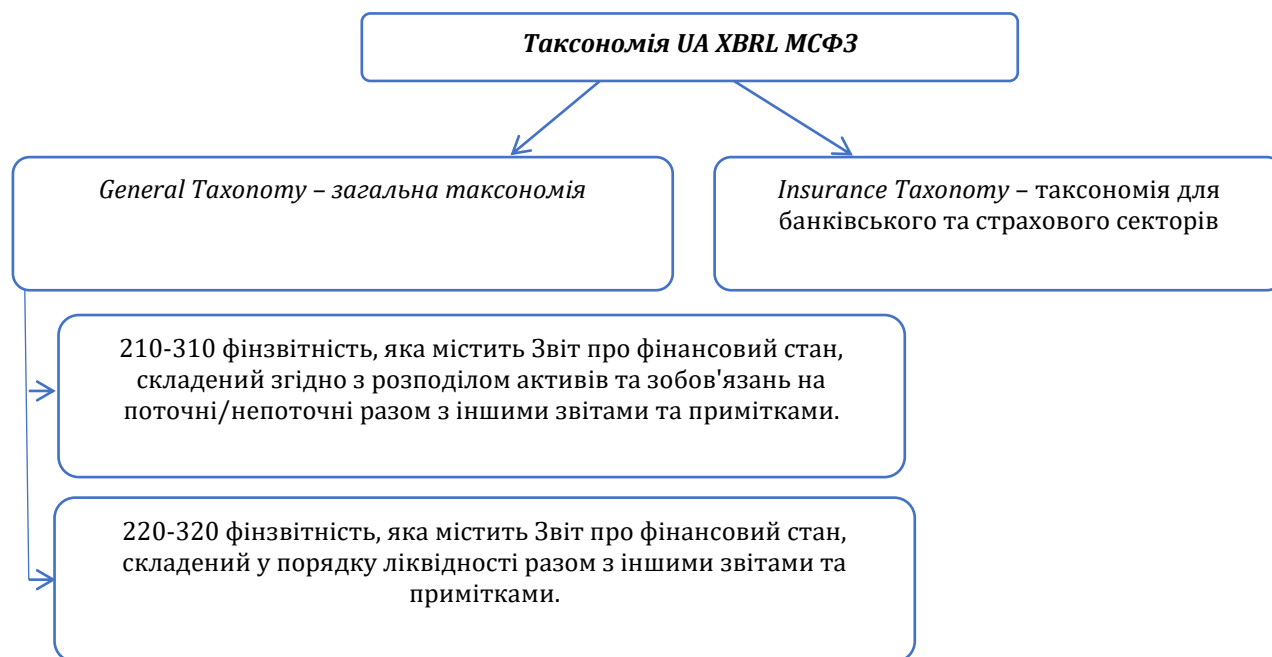
Рис. 3. Особливості таксономії UA XBRL МСФЗ [1]

Затверджена Міністерством фінансів таксономія звітності у форматі UA XBRL МСФЗ є адаптованою до вимог вітчизняного законодавства, зокрема вона містить звіт про управління та звіт аудитора, що є обов'язковими елементами пакету звітності, що подається вітчизняними компаніями. Особливості вітчизняної таксономії представлені на рис.3.